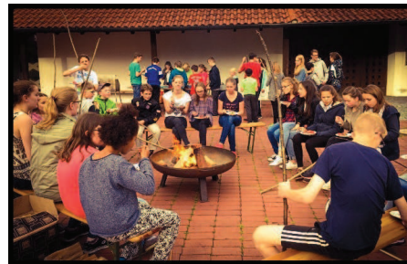
Auf der Feuerschale wurde Stockbrot gebacken

Stress bis spät nachts da sein kann!“ „Es war toll mit so vielen was zusammen zu machen. Man muss so etwas unbedingt wieder machen. Und zwar ganz bald ☺“