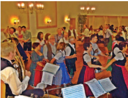
Auf geht's zum Kirtatanz!

In Zusammenarbeit mit dem Dachauer Forum hat der Pfarrgemeinderat Großinzemoos zum traditionellen Kirtatanz eingeladen.