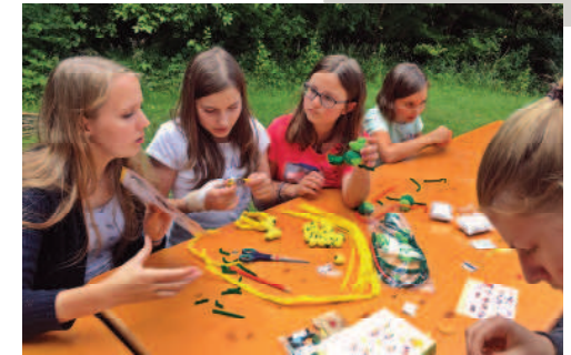
Das Basteln machte allen Spaß

Der erste Versuch, eine Jugendfahrt nach Taizé anzubieten, hat geklappt ☺ (siehe Artikel Taizé) und soll wieder stattfinden!