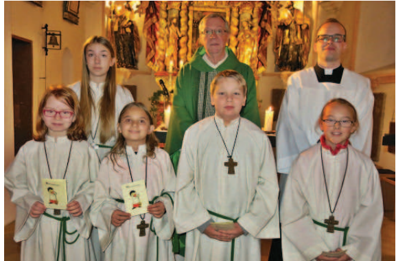
In Röhrmoos wurden vier neue Minis eingeführt