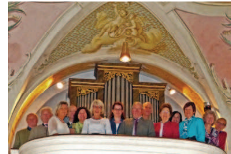
Der Kirchenchor feierte heuer sein 100-jähriges Bestehen.

100 Jahre Kirchenchor und 150 Jahre Orgel St. Vitalis Sigmertshausen