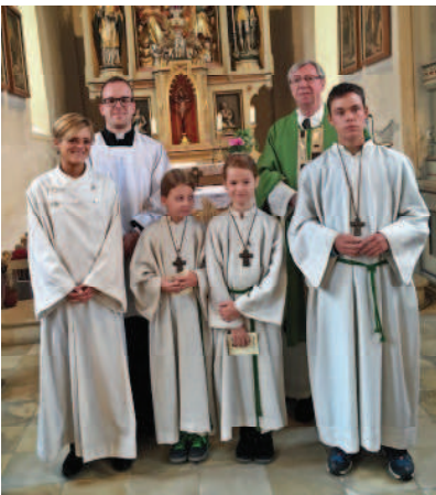
Drei neue Minis in Großinzemoos