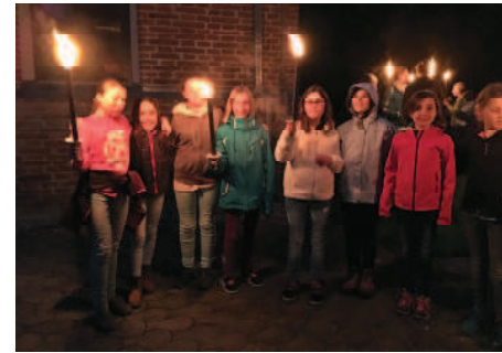
Auf der Nachtwanderung durften Fackeln nicht fehlen