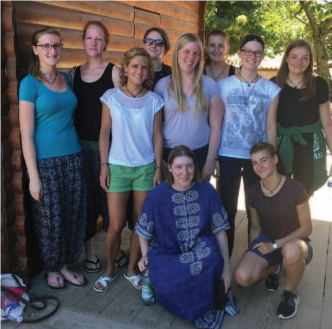
Die Teilnehmer der Taizé-Fahrt

Eigentlich lässt sich diese Frage ziemlich leicht beantworten: schlafen (wenn auch nicht sehr lange ☺), essen, in die Kirche gehen, sich in Gruppen über das Leben austauschen und einfach Spaß haben. Weil das so immer etwas abschreckend klingt, versuche ich es mal genauer zu erklären.