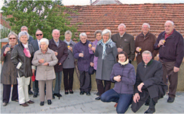
Die Ehe- und Geburtstagsjubilare ließen sich feiern

Zum diesjährigen Patrozinium der Pfarrgemeinde St. Georg in Großinzemoos hat der Pfarrgemeinderat wieder alle Ehejubilare und Geburtstagsjubilare des vergangenen Jahres eingeladen. Im Anschluss an den Gottesdienst fand ein kleiner Stehempfang statt, der trotz des kalten Wetters ein schöner Ausklang war.