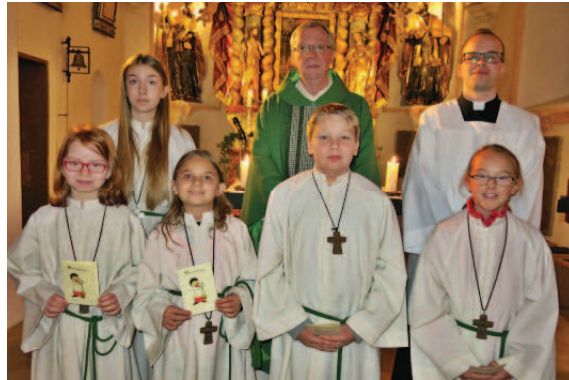
In Röhrmoos wurden vier neue Minis eingeführt