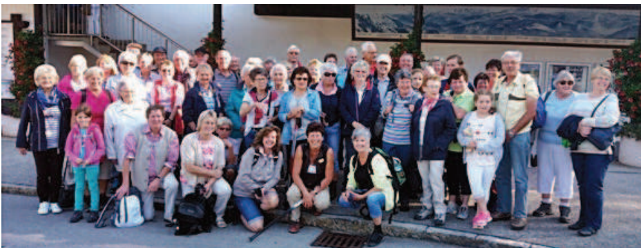
Zahlreiche Besucher der Bergmesse fanden sich an der Talstation der Kampenwandbahn ein.

Am 24. September dieses Jahres nun wurde er vom Papst Franziskus in die Schar der Seligen aufgenommen. Für viele ist er wegen seiner Solidarität mit den Ärmsten der Armen heute schon ein