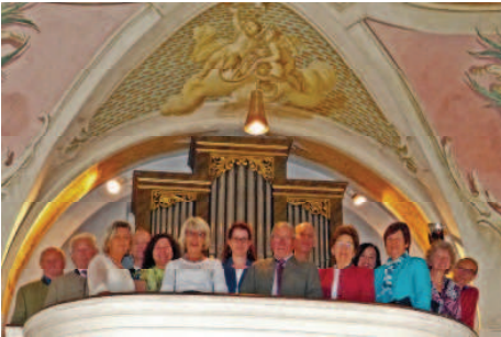
Der Kirchenchor feierte heuer sein 100-jähriges Bestehen.

100 Jahre Kirchenchor und 150 Jahre Orgel St. Vitalis Sigmertshausen