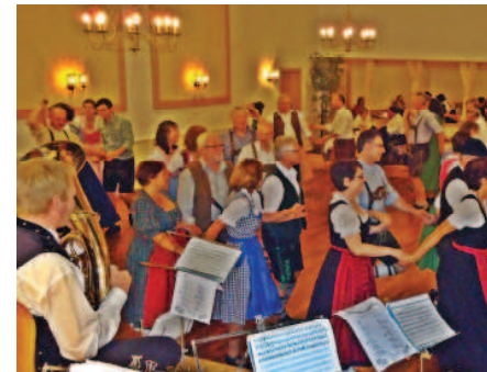
Auf geht's zum Kirtanz!

In Zusammenarbeit mit dem Dachauer Forum hat der Pfarrgemeinderat Großinzemoos zum traditionellen Kirtanz eingeladen.