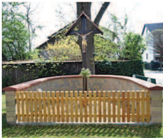
Das neu eingeweihte Wegkreuz

Am 24.04.2016 wurde das restaurierte Wegkreuz an der Haimhauser Straße in Ampermoching von Fr. Döring und Herrn Prinzhorn feierlich eingeweiht. Die musikalische Gestaltung übernahmen einige Bläser der Blaskapelle Schönbrunn. Trotz des sehr durchwachsenen Wetters kamen ca. 80 Personen zur Einweihung. Nach der Andacht und