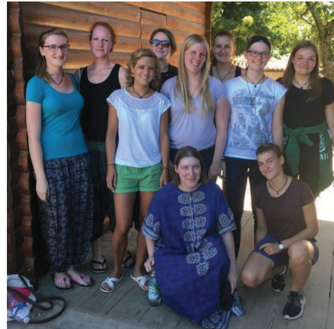
Die Teilnehmer der Taizé-Fahrt

Eigentlich lässt sich diese Frage ziemlich leicht beantworten: schlafen (wenn auch nicht sehr lange ☺), essen, in die Kirche gehen, sich in Gruppen über das Leben austauschen und einfach Spaß haben. Weil das so immer etwas abschreckend klingt, versuche ich es mal genauer zu erklären.