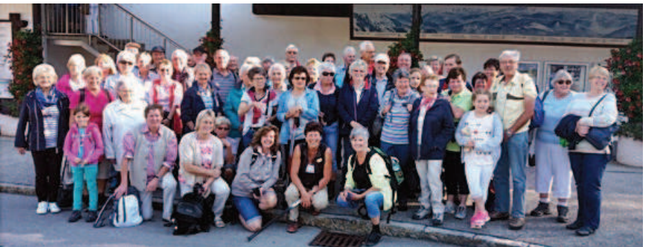
Zahlreiche Besucher der Bergmesse fanden sich an der Talstation der Kampenwandbahn ein.