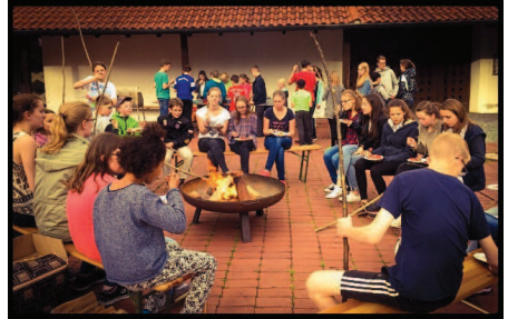
Auf der Feuerschale wurde Stockbrot gebacken

Stress bis spät nachts da sein kann!“ „Es war toll mit so vielen was zusammen zu machen. Man muss so etwas unbedingt wieder machen. Und zwar ganz bald ☺“