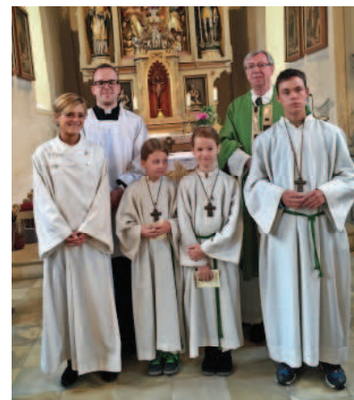
Drei neue Minis in Großinzemoos