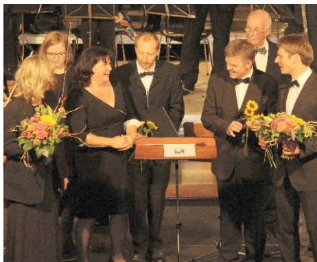
Freude bei den Solisten