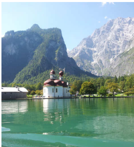
St. Bartholomä am Königssee

Anstelle eines Ausflugs am 8. September, der mangels Teilnehmer abgesagt werden musste, hat uns die Firma Astl netterweise angeboten, an der Donnerstagsfahrt zum Königssee teilzunehmen.