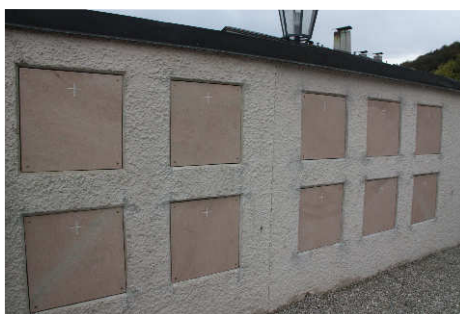
Die neue Urnenwand

Urnenwandgräber (in der Friedhofsmauer, Nähe Sakristei). Zwischenzeitlich wurde von der Kirchenverwaltung auch die Friedhofsordnung überarbeitet. Sie wird im Schaukasten neben dem Eingangstor an der Nordseite ausgehängt. Nähere Informationen über einen Graberwerb erhalten Sie im Pfarramt Oberaudorf unter Telefon 08033 1459.