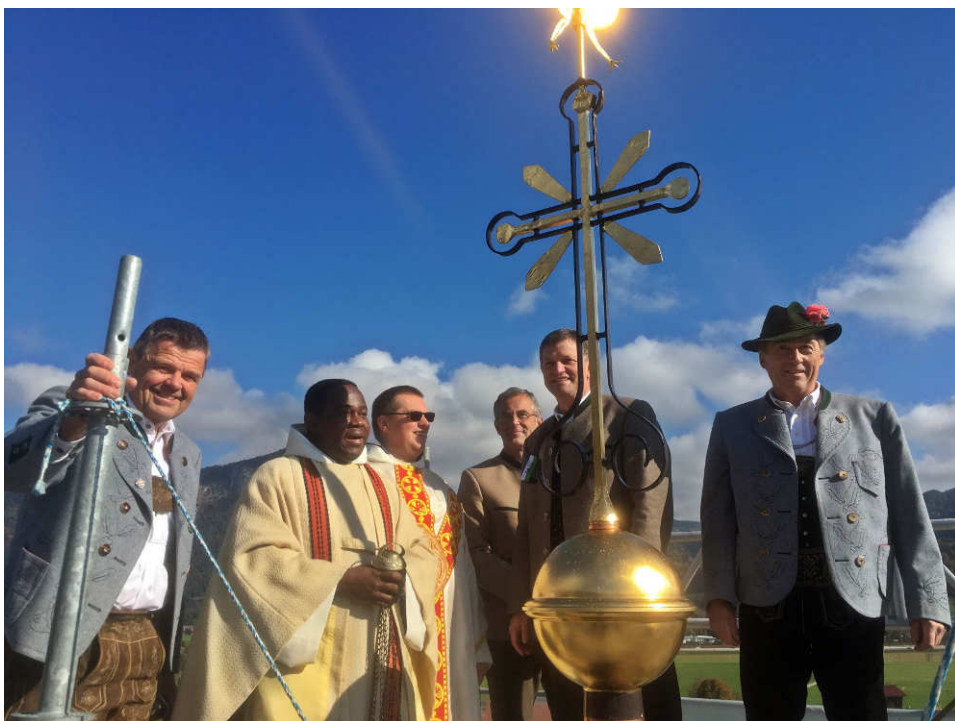
Die neue Turmspitze ist aufgestellt.

Mit der Anbringung an der Turmspitze, ist der Bauabschnitt Außenrenovierung abgeschlossen. Kleinere Nacharbeiten sind noch zu verrichten.