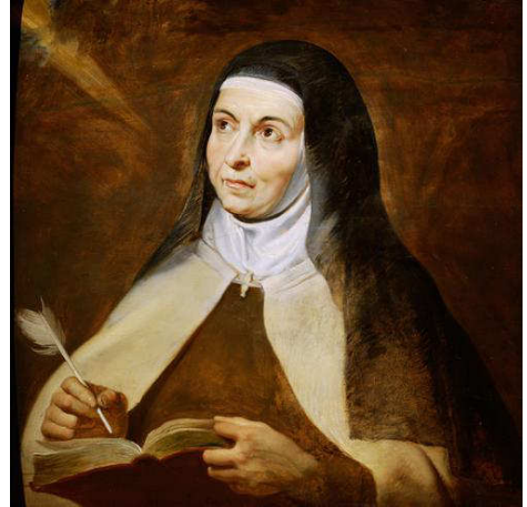
Teresa, Gemälde von P.P. Rubens, um 1615, KHM

Am 4. Oktober 1582 starb sie in Alba de Tormes. Sie wurde 1614 selig und 1622 von Papst Gregor XV. heilig gesprochen. 1970 wurde ihr als erster Frau in der Kirche der Titel Kirchenlehrerin verliehen.