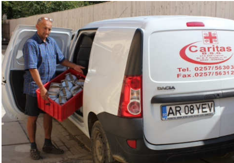
Die Caritas liefert an Bedürftige

Die diesjährige Weihnachtsspendenaktion der Rumänienhilfe im Dekanat Inn-tal gilt einem der ältesten Hilfsangebote unserer rumänischen Partner. Seit der Gründung der Caritas Lipova im Jahr 1991 bietet diese warmes Mittagessen für Bedürftige an.