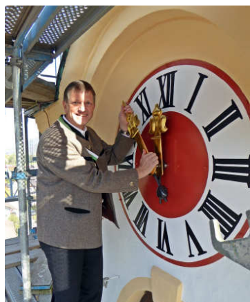
Der Bürgermeister möchte die Zeit voranbringen.