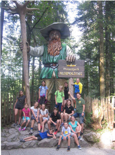
Die Gruppe im Märchenpark

Zum Ende der Sommerferien besuchten wir noch den Märchenpark in Rumpolding. Auf den Spuren von riesigen Trollen, kleinen Zwergen und gefährlichen Drachen wurden wir zu wahren Schatzsuchern. Zahlreiche Edelsteine durften wir an diesem Tag als Andenken mit nach Hause nehmen. Die Achterbahn des Parks haben wir ausgiebig getestet. Bei vielen kleinen Wettkämpfen konnten wir gegeneinander antreten: Wer ist der beste Bogenschütze? Wer ist der schnellste Maibaumkraxler? Todesmutig stürzten wir uns eine fast senkrechte Rutsche hinab. Zur Erholung gab's dann eine kleine Stärkung im Zauber-Restaurant. Viel zu schnell ging für uns dieser märchenhafte Tag zu Ende. Danke an alle Eltern, die uns diesen weiten Weg gefahren haben!