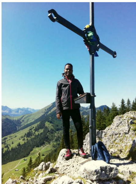
Auf dem Brunnstein

Manchmal wenden sich die jungen AsylbewerberInnen an uns mit Fragen, die ihre Asylanträge betreffen, oder wenn sie Briefe vom „Amt“ erhalten. Hier bewährt sich unsere gute Vernetzung mit den Mitgliedern der Helferkreise in Kiefersfelden und Oberaudorf, denen wir auch selbst angehören, wodurch meistens sehr schnell Hilfe organisiert werden kann. Ebenso gibt es sehr gute Kontakte zur Schule, der Schulsozialarbeiterin und der Asylsozialberaterin vom BRK. Hierbei zeigt sich, dass ein gut organisierter Helferkreis mit Teams für verschiedene Berei-