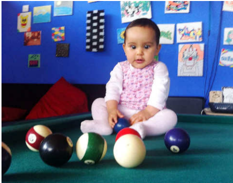
Erste Begegnung mit dem Billard

che sinnvoll und wichtig für eine effektive Arbeit ist, genauso wie die persönlichen Beziehungen, die sich im Laufe der Zeit entwickeln, einen wichtigen Beitrag zur Integration leisten.