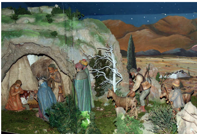
Die Geburtsgrotte in der Krippe von Oberaudorf