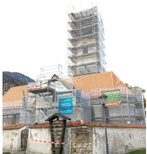
Die Nische für eine Statue

Mit der Außenrenovierung sind die Arbeiten leider noch nicht abgeschlossen. Für die Innenrenovierung und der Anschaffung einer neuen Orgel werden Kosten in Höhe von ca. 1.000.000 € geschätzt. Ich hoffe, dass wir das Objekt mit der Unterstützung der Erzdiözese, der Gemeinde und mit Spenden aus der Bevölkerung ebenfalls bewerkstelligen können.