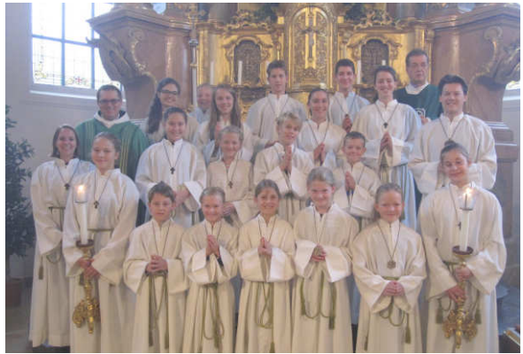
Die Oberaudorfer Ministranten