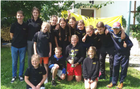
Das sportliche Mini-Team

Beim Dekanats-Völkerball Turnier in Neukirchen am 16.7. wärmten sich alle Minis erstmal gründlich auf. Beim gemeinsamen Hampelmann-machen, hatten alle großen Spaß. Wir Oberaudorfer trafen in vielen Runden auf sehr starke Teams, konnten uns aber dennoch Runde für Runde durchkämpfen. Schließlich standen wir im Finale und konnten uns auch hier behaupten. Über