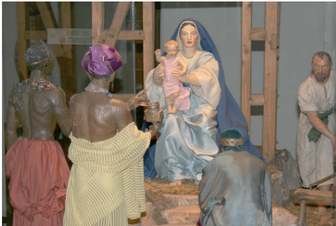
Hipp-Krippe in Kiefersfelden: Besuch der Weisen

Bevor der Christbaum in Kirchen und Häusern aufgestellt wurde, galt an Weihnachten der figürlichen Darstellung der Geburt Jesu in Bethlehem die Aufmerksamkeit. Auch in unseren Kirchen werden jedes Jahr liebevoll verschiedene Krippen aufgestellt, damit die Gläubigen die Geburt Jesu vor Augen haben und sich dankbar an die Menschwerdung Gottes erinnern.