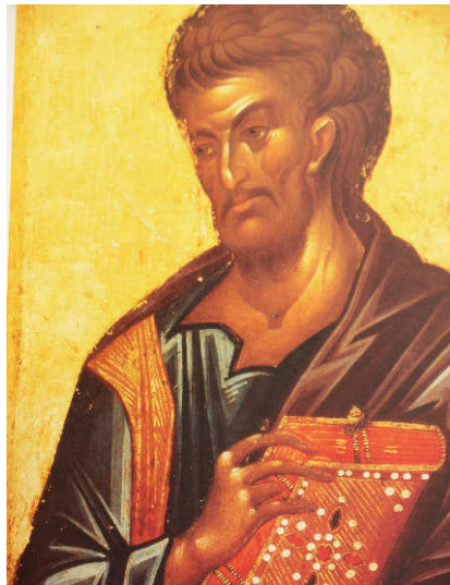
Der heilige .....

Auch soll er die „Apostelgeschichte“ geschrieben haben. Diese ist auch ein Teil der Bibel.