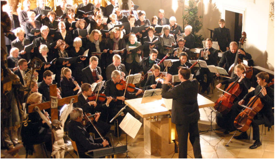
Chor und Orchester in der Pfarrkirche Oberaudorf

Im Kirchenchor Oberaudorf proben wir derzeit unter anderem an folgenden Chorsätzen: