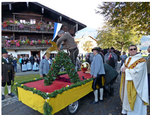
Ein Wagen mit prächtigen Rössern brachte die Turmspitze.

Das Spendenkonto lautet: Kuratie Niederaudorf Reisach "Renovierung Pfarrkirche St Michael" IBAN::DE10 7116 2355 0000 0114 52 Raiffeisenbank Oberaudorf Kirchenverwaltung Niederaudorf-Reisach