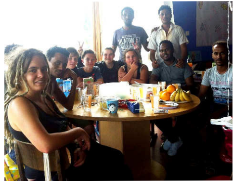
Fremde werden Freunde

Der Kirchennebenraum der Auferstehungskirche ist zum "Asyl-Cafe" geworden. Tische und Stühle, ein Radio und