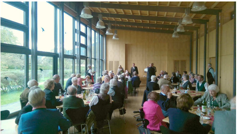
Am 15. Oktober feierten viele Ehejubilare des Pfarrverbandes nach einem Gottesdienst in der Pfarrkirche im Pfarrheim Heilig Kreuz, bewirte vom Pfarrgemeinderat Kiefersfelden