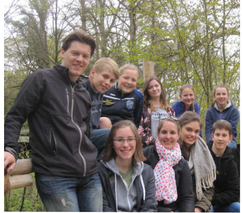
Im Tierpark Hellabrunn

An Ostern verteilten wir selbstbemalte Eier an die Gottesdienstbesucher und sammelten dabei freiwillige Spenden für einen Ausflug in den Münchner Tierpark Hellabrunn. DANKE an alle, die uns hier unterstützt haben. Am 16.4. war es dann soweit: eine ganze Truppe voll motivierter Tierforscher erkundete den Zoo. So sahen wir seltene Fische, wurden von Fledermäusen erschreckt und be-