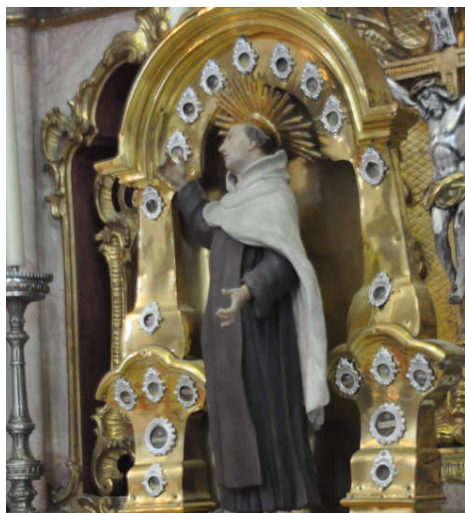
Johannes vom Kreuz