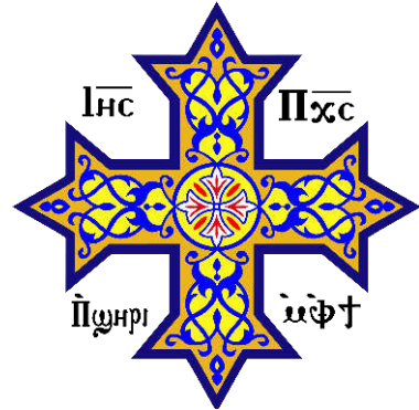
Koptisches Kreuz, verwandt dem Jerusalemkreuz

Der koptisch-orthodoxen Kirche steht ein Papst vor mit Sitz in Kairo und Alexandrien. Seit 2012 ist es Tawadros II. Er war ein Mönch. Das Mönchtum wurde in