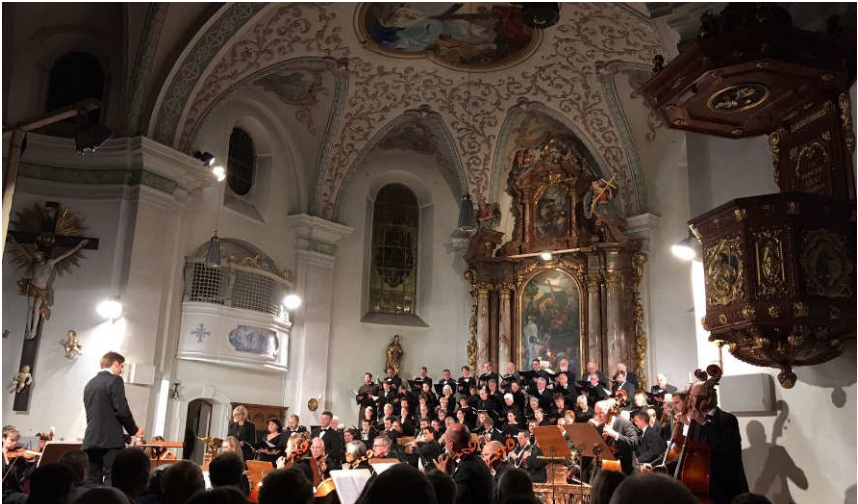
Eindrucksvolle Atmosphäre beim Konzert