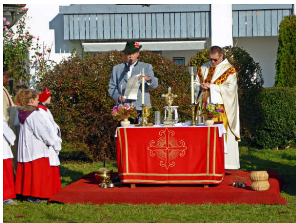
Feldmesse beim Leonhardifest