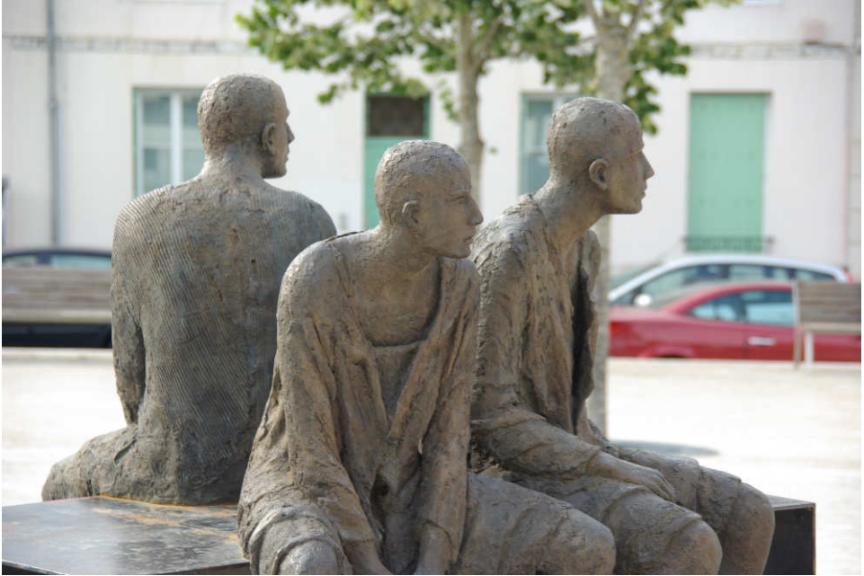
„Erwartung“ – von Jim Wanderscheid

Jesus war einmal da, vor ca. 2000 Jahren. Man könnte die beneiden, die ihn sehen, hören, umarmen durften. Aber heute? Er sagt es selbst: „Ich bin bei euch alle Tage bis zum Ende der Welt.“ Nur in Erinnerung? Nur in Symbolen?