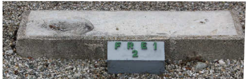
Kennzeichnung freier Gräber

In Kürze verfügt die Friedhofsverwaltung im Pfarrfriedhof auch über zehn