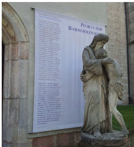
Die Pforte der Barmherzigkeit in Berchtesgaden

sondern auch das unvergleichliche Königssee-Echo auf der Trompete geblasen. Der grüne, fast spiegelglatte Königssee, die steilen Felswände mit dem Watzmann, der Watzfrau und den sieben Kindern, die steile Watzmann-Ost-