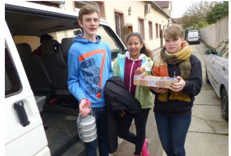
Essensausgabe durch Freiwillige

Die meisten Bedürftigen, die von der Caritas Lipova Mittagessen bekommen, freuen sich, wenn sie die Portionen ins Haus geliefert bekommen. Vielen geht es gesundheitlich nicht so gut, dass sie täglich zum Caritas-Haus kommen könnten, um ihre Mittagsmahlzeit ein-