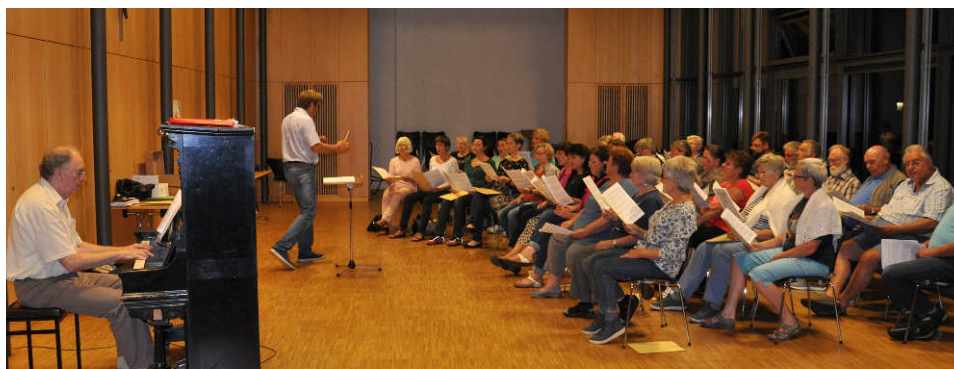
Probe im Pfarrheim

ters Christoph Danner. Der Grundstein für diese wunderbare Idee wurde nach dem erfolgreichen Zusammenwirken des Kirchenchors Oberaudorf, des Männerchors Reisach und des Kirchenchors Kiefersfelden bei der Pfarrverbandsgründung im Januar des Jahres gelegt. Ein gigantisches Projekt nahm seinen Anfang. Chöre, Sänger und Musiker wurden über die Idee informiert. Und die Rückmeldungen waren gewaltig. Es gelang einen über 60 Sängerinnen und Sänger zählenden Chor auf die Beine zu stellen – den Konzertchor Oberinntal. Außerdem konnten insgesamt über 50 Musiker gewonnen werden. Ein Symphonieorchester wurde neu gegründet: das GrenzlandOrchester.