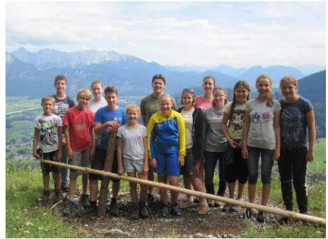
Auf der Felixalm