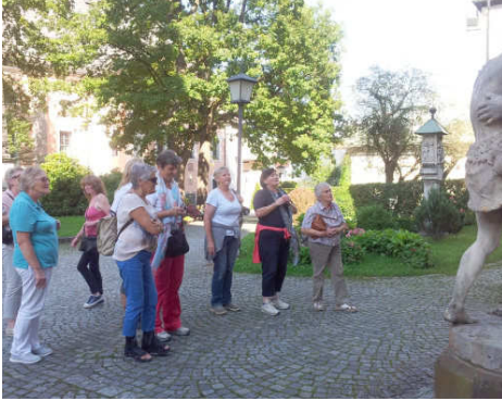
Die Teilnehmerinnen blicken auf die Stiftskirche

Chorherren erbaute Stiftskirche St. Peter und Johannes der Täufer besichtigt. Zurzeit ist dort die Pforte der Barmherzigkeit geöffnet. Diese konnten wir durchschreiten und uns zu einer kleinen Andacht versammeln.