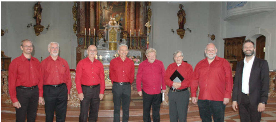
Die Schola St. Ulrich Unterschleißheim in Heilig Kreuz

Weltweit sollte die Botschaft der Heiligen Schrift verständlich sein; deshalb entwickelte sich, von Rom ausgehend, Latein als die Sprache der katholischen Kirche. Über Jahrhunderte war sie das verbindende Element. Überall wurden die gleichen Gebete gesprochen, dieselben Texte gelesen. Erst nach dem Zweiten Vatikanischen Konzil hat die Landessprache Vorrang erhalten.