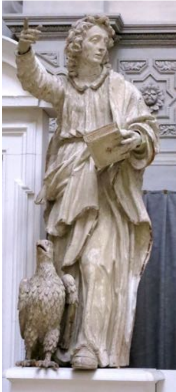
Evangelist Johannes mit Adler

Der Adler ist in vielen Kulturen das Sinnbild der Stärke und des Göttlichen. In der präkolumbianischen Kultur galt er als Bezwinger der Schlange und damit der negativen Kräfte, die den Menschen bedrohen. Sein Flug hoch am Himmel galt Assyrern, Babyloniern und Persern als Symbol für geistige Höhe und göttliche Majestät. In der römischen Mythologie war er Sinnbild der Allmacht und der Allwissenheit und damit Begleiter der höchsten Gottheiten, insbesondere Jupiters. Deshalb wurde er auch das Zeichen für die Macht des römischen Kaisers und fand Verwendung als Heeres- und Feldzeichen.