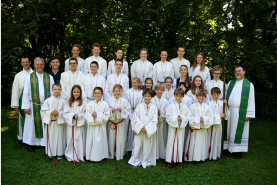
Pfarrfest mit Einführung der Neuminis am Sonntag, 10. Juli