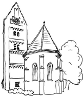
Pfarrei St. Martin, Untermenzing