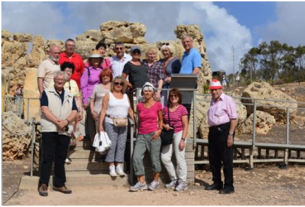
Tempelanlage von Ggantija

Zu Fuß erkundeten wir die Stadt und ließen uns beeindrucken von den zahlreichen alten Bauwerken, den Festungsanlagen, Hospitälern und Kirchen (Besichtigung der St. Paul Shipwrecked Church und der prachtvollen St. John Co Kathedrale). Vom Barracca-Garten genossen wir einen hervorragenden Ausblick auf Maltas Naturhafen, den schönsten Europas.