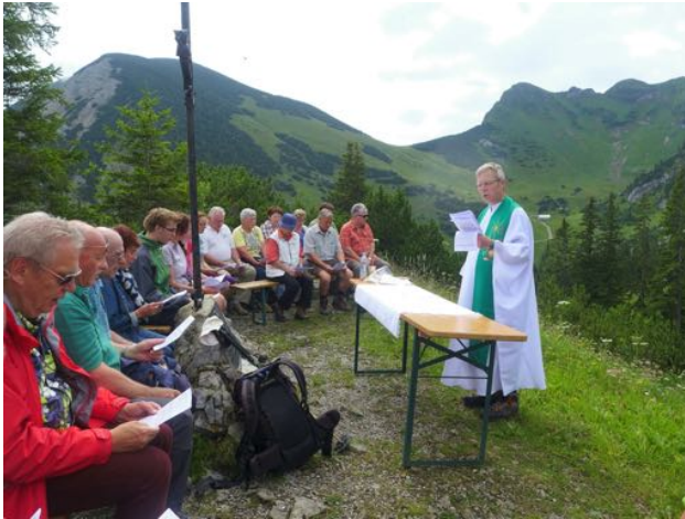
Berggottesdienst der Pfarreiengemeinschaft am Taubensteinhaus am Samstag, 23. Juli