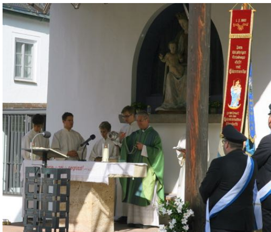
Wallfahrt der Pfarreiengemeinschaft nach Maria Eich am Samstag, 3. Juli