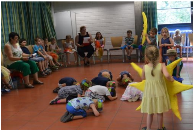
Der Kindergarten besucht den Seniorennachmittag