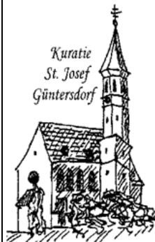
Kuratie St. Josef Güntersdorf