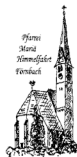
Pfarrei Maria Himmelfahrt Förnbach