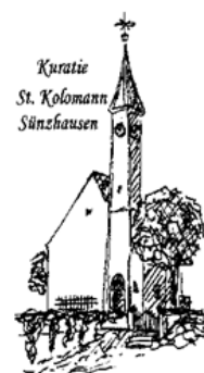
Kuratie St. Koloman Sünzhausen

Internetseiten im Pfarrverband: www.erzbistum-muenchen.de/PV-Schweitenkirchen www.erzbistum-muenchen.de/Schweitenkirchen www.erzbistum-muenchen.de/MariaeHimmelfahrtFoernbach