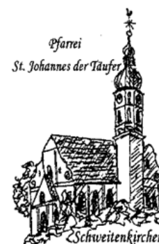
Pfarrei St. Johannes der Täufer Schweitenkirchen