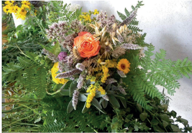
Kräuterbuschen aus Baierbrunn

Telefonische Ansage der Gottesdienstzeiten: 08178 / 9488 688