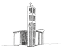
St. Thomas Morus