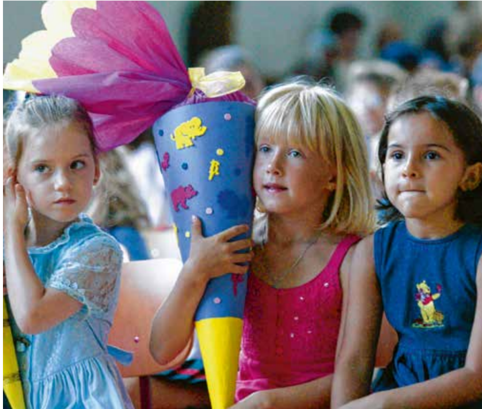
Der erste Schultag ist spannend und aufregend.

N un beginnt er, der neue Lebensabschnitt. Die meisten ABC-Schützen fiebern ihrem ersten Schultag entgegen. Das unbekannte Neue ruft aber auch Ängste und Unsicherheiten hervor – bei Kindern wie bei Eltern. Sie sollten sich Zeit nehmen für die Fragen der Kleinen. Wer geduldig Rede und Antwort steht und ein realistisches, positives Bild von der Schule vermittelt, ermutigt sein Kind – auch zum Weiterfragen. Neugier ist wichtig fürs Lernen. Sprüche wie „Dann beginnt der Ernst des Lebens“ oder „Warte nur, bis du in die Schule kommst, da darfst du nicht so herumalbern“ sind tabu. Solche Aussagen empfinden Kinder als Drohung und besetzen den Schulstart negativ. Was können Eltern tun, damit der Tag zu einem schönen Erlebnis wird, an das sich das Kind später gern erinnert?