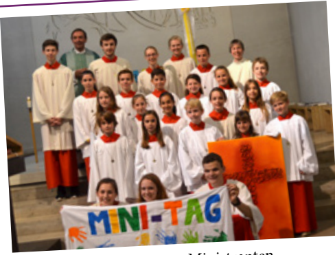
Einführung der neuen Ministranten