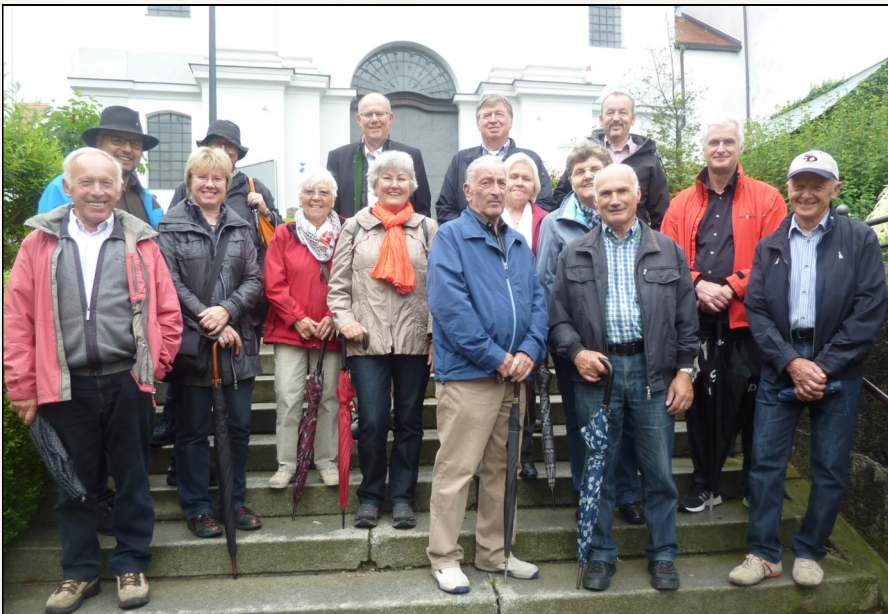
Die interessierten Teilnehmer des Kultourausflugs

Alles in allem eine interessantes und rundum lohnendes Ausflugsprogramm, das die Oberrother mit einer gemütlichen Brotzeit im Gasthof Maierbräu ausklingen ließen.