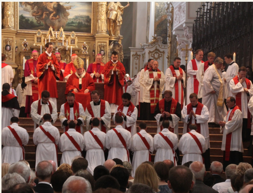
Priesterweihe im Freisinger Dom am 25. Juni 2016