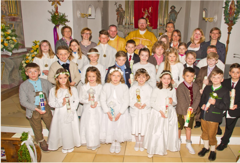
Kommunionkinder am 3. April in Schwabhausen

Ich verstehe es nicht, ich fasse es nicht, und doch ist es da, kann nicht gelegnet werden.