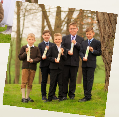
Kommunionkinder am 10. April in Schwabhausen