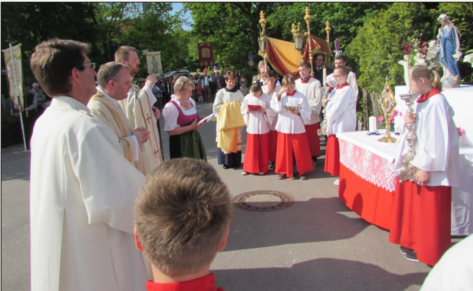
Erster Segensaltar in Bergkirchen