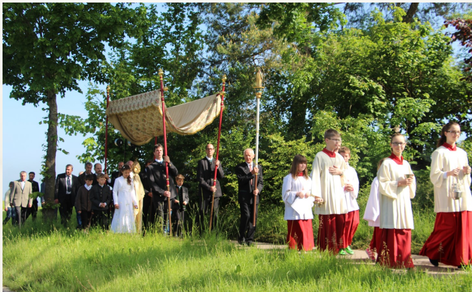
Prozession in Oberroth

Wir danken allen Familien, die sich für die liebevolle Gestaltung und Ausschmückung von Hausaltären immer wieder einsetzen und damit die Fortführung dieses ehrwürdigen und sinnvollen Brauches ermöglichen.