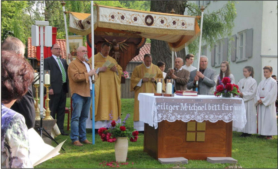
Heilige Messfeier im Schwabhauser Pfarrgarten