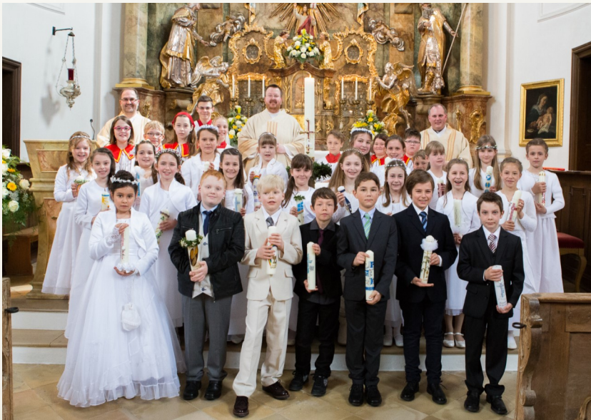
Kommunionkinder am 3. April in Bergkirchen

Wunder von Heilung und Rettung, aus tückischer Krankheit, aus zerbrochener Beziehung, aus Krieg und Gefangenschaft.