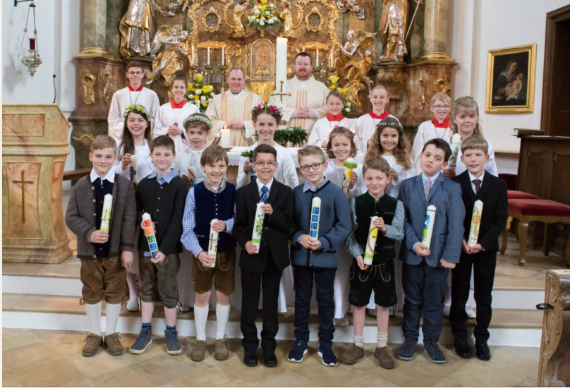
Kommunionkinder am 10. April in Bergkirchen

Wunder der Wandlung von Böse zu Gut, vom Verlorenen zum Gefundenen, von Verzweiflung zu Hoffnung, von Brot und Wein in Seine Gegenwart.