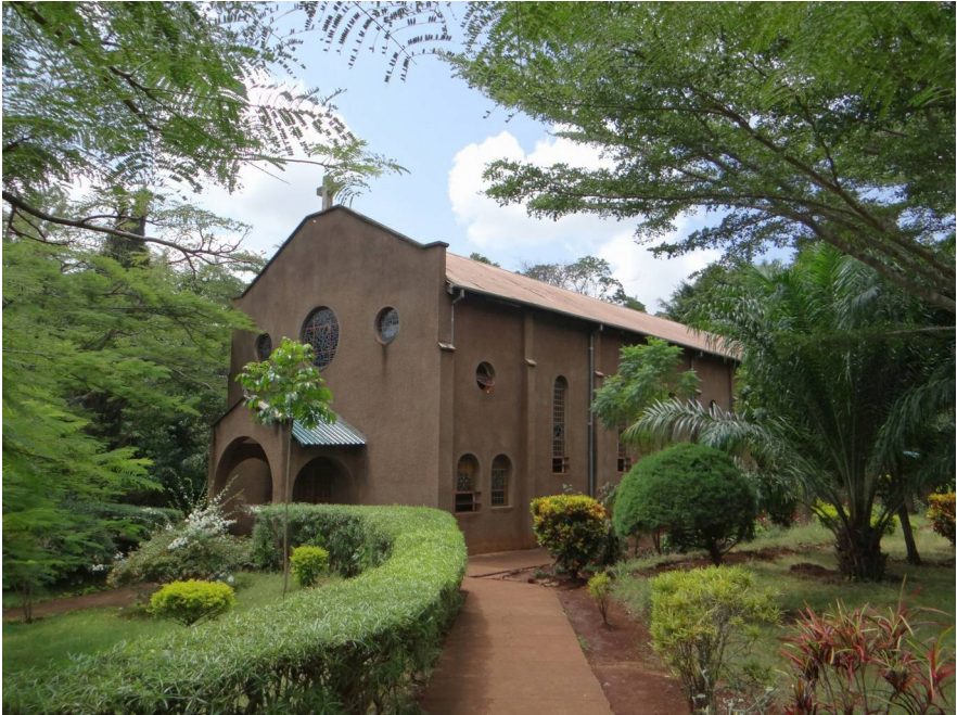
Die Kirche des Schülerseminars

Das Seminar, das in der Nähe von Moshi, also ca. 60 Km südlich der Grenze zu Kenia am Fuße des Kilimanjaro liegt, ist als Internat organisiert, in dem ca. 150 - 200 Studenten leben, die eine schulische Ausbildung erhalten, um zur nächsten Priestergeneration oder zur intellektuellen Elite herangezogen zu werden. Disziplin und ein straff durchgeplanter Tagesablauf sind dabei an der Tagesordnung. Der Morgen beginnt stets mit einem Gottesdienst um 6 Uhr mit viel Gesang und viel Musik. Die Rhythmik liegt einfach im Blut der Afrikaner; da kann man nur neidvoll zuschauen, und es nur ansatzweise versuchen gleichzutun. Englisch ist die Schulsprache - bis zur Unabhängigkeit im Jahre 1961 war Tansania eine englische Kolonie; die deutsche Kolonialzeit endete bereits nach dem 1. Weltkrieg. Die Jungen müssen sich bis auf das Kochen selbst versorgen, dazu gehören auch Wäsche waschen und Gärtnerarbeit, aber auch Autowaschen und kleine Dienstleistungen für die Priester. Das alles geschieht neben einem ganztägigen Unterricht, dessen Niveau mit einer gymnasialen Ausbildung in Deutschland durchaus vergleichbar ist. Hilfe aus Europa, finanzieller oder personeller Art wird dabei gerne angenommen, sei es durch Stipendien, sei es durch die Aufnahme von jungen Erwachsenen im Freiwilligen Sozialen Jahr. Zur Zeit wird an einem Pilotprojekt zur Inklusion Behinderter gearbeitet, für das Father Severian in den letzten Jahren gesammelt hat: Es wird eine neue Schule mit angeschlossenem Internat