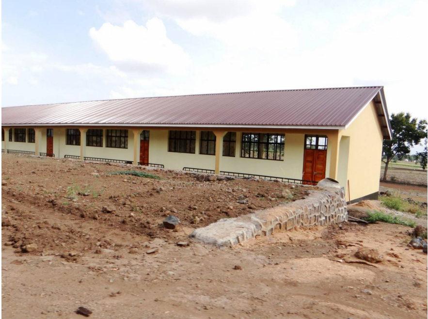
St. Pamachius inclusive School

gebaut, in dem Nicht-Behinderte zusammen mit Behinderten ausgebildet werden sollen. Wir konnten bei unserem Besuch das erste, fast vollständig erstellte Gebäude (Schulhaus) bestaunen, das behindertengerecht konstruiert und ausgerüstet ist. Der Aufbau des Wohngebäudes wurde zu dem Zeitpunkt gerade initiiert; die Schule soll 2017 eingeweiht werden. Afrika ist uns da weit voraus!