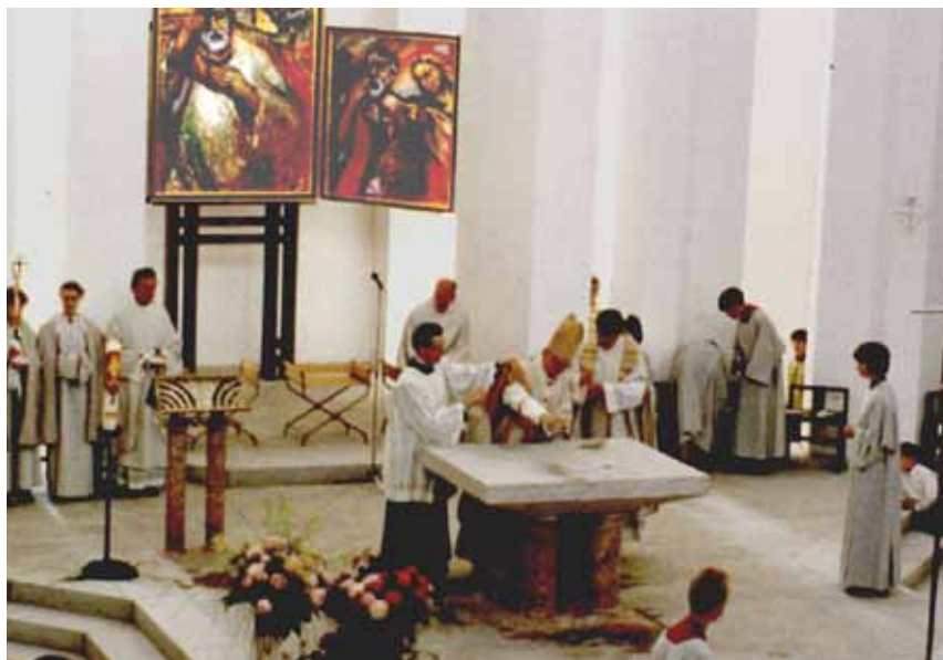
Einweihung der Kirche 1991