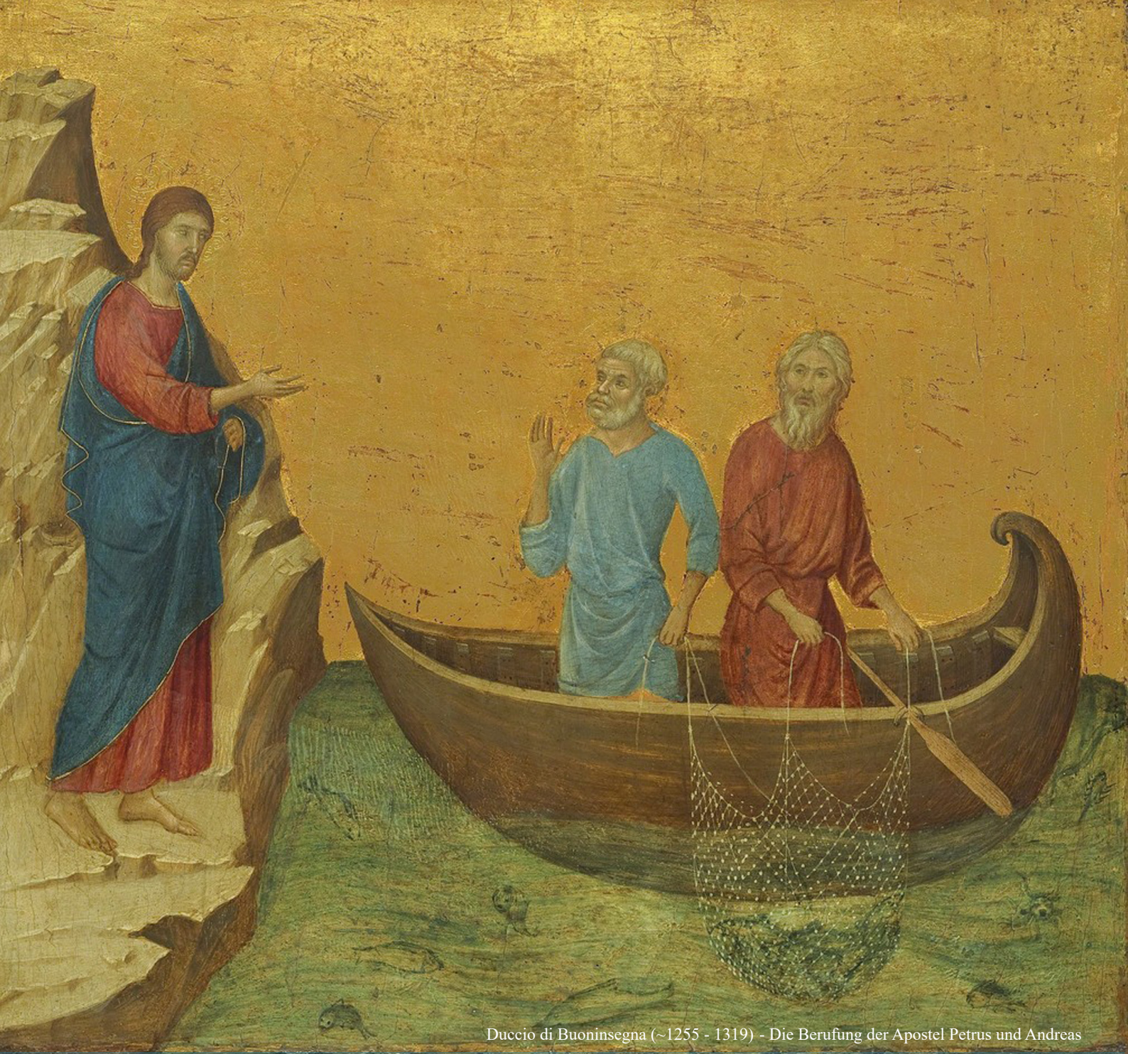
Duccio di Buoninsegna (~1255 - 1319) - Die Berufung der Apostel Petrus und Andreas