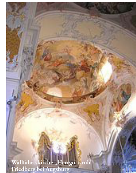
Wallfahrtskirche „Herrgottsruh“ Friedberg bei Augsburg