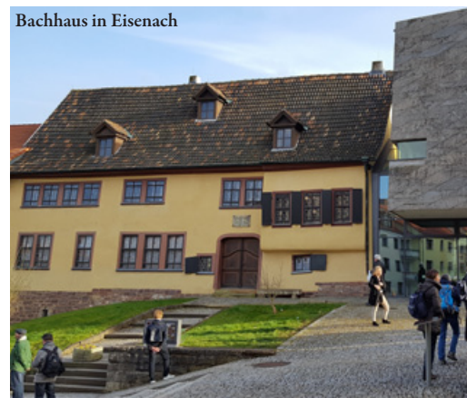
Bachhaus in Eisenach

Erfurt – die wunderbare, mittelalterliche Stadt, die als thüringisches Rom bezeichnet wurde – nannte Luther seine geistige Heimat, in der er 10 Jahre seines Lebens verbrachte. Dort war er 1505 in das Augustinerkloster eingetreten, hatte die geplante weltliche Laufbahn als Jurist verlassen, Theologie studiert und wurde zum Priester geweiht. Bestens renoviert zeigte sich das Renaissance-Ensemble der Luther-Begegnungsstätte mit Kirche, Kreuzgang, Klostertrakt und Wirtschaftshof. Eine fachkundige Führung zeigte uns den zeithistorischen Hintergrund.