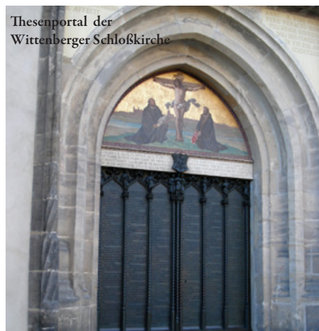
Thesenportal der Wittenberger Schloßkirche