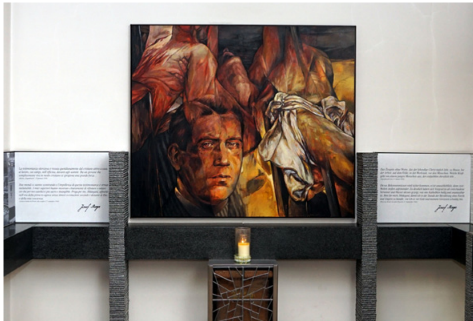
Mayr-Nusser Gedenken in der Kirche von Lichtenstern am Ritten

Der künftige Selige sei „ein überzeugter und überzeugender Christ“ gewesen, „der