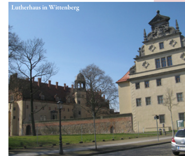
Lutherhaus in Wittenberg

Wir folgten Luthers Spuren mit dem ICE zum Ausgangspunkt der Reformation in Wittenberg an der Elbe. An der dort neu gegründeten Universität des Kurfürsten von Sachsen war Luther 1511 Professor geworden, erhielt den Dokortitel für Theologie und wurde Prediger der Stadtkirche. Am 31. Oktober 1517 forderte er mit einem Aushang an der Schlosskirche das Ende des Ablasshandels.