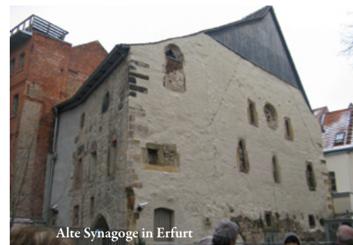
Alte Synagoge in Erfurt

Ein besonderes Erlebnis war die Besichtigung der wiederentdeckten Alten Synagoge, des dort gefundenen Erfurter Judenschatzes und der Mikwe (rituelles Tauchbad).