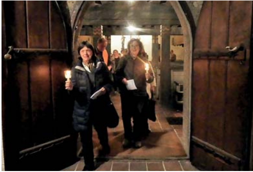
Ökumene in Fürstenfeldbruck: Lange Nacht der Christen am 31. März 2017 Nach dem Impuls in der Erlöserkirche