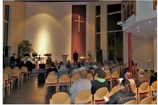
Impuls bei der Freien Evangelischen Gemeinde

meinem Glauben entspricht, dann gibt es für mich keine trennenden Unterschiede. Vielleicht mag es atmosphärische Unterschiede geben, aber nicht alle Familien gleich, alle evangelischen Familien sind unterschiedlich, alle katholischen Familien sind unterschiedlich. Oder, was Herr Reimers schon sagte, wenn wir kontinental denken: Afrikanische Christen ticken anders als wir, auch als Katholiken. Von daher müssen wir sehen, dass wir den Reichtum, den wir anvertraut bekommen haben, in einer guten Weise nützen. Der Reichtum heißt, lässt uns Erfahrungen weiter sammeln und in eine Selbstverständlichkeit des gemeinsamen Tuns eintreten.