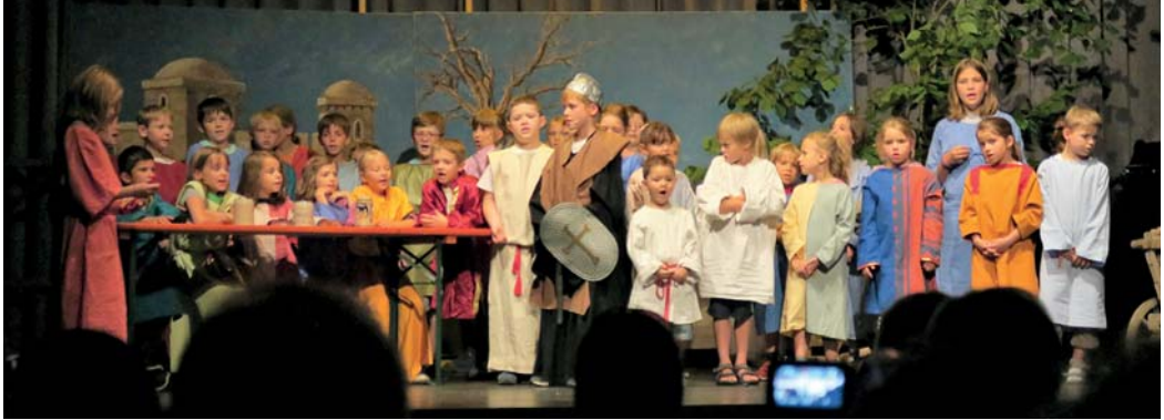
Ökumene in Fürstentfeldbruck: Kindermusical „Der falsche Ritter – Bilder aus dem Leben des großen Reformators Dr. Martin Luther“ mit den Kinderchören der katholischen und evangelischen Gemeinden in Fürstentfeldbruck am 16. Juli 2017.

zu gewinnen. Das ist natürlich viel komplizierter, viel schwieriger, als wenn die jungen Menschen in ihren Familien das schon alles mitbekommen und lernen. Für uns ist das eine Herausforderung, denn wir leben immer noch in der Selbstverständlichkeit der Traditionsweitergabe. Wir sind noch nicht darauf eingestellt, dass wir viel stärker mit jungen Menschen, mit Erwachsenen ins Gespräch kommen oder ganz andere Anknüpfungspunkte finden müssen, die wir bisher nicht hatten. In der frühen Kirche gab es ein Faszinosum am christlichen Glauben, das die Menschen dazu gebracht hat, in Scharen zur Kirche hinzu zu kommen: Das ist der Gott, dem wir folgen möchten, das ist die Form von Lebensgestaltung, die wir für uns in all den Katastrophen in denen wir leben, brauchen, um gut und sicher und mutig leben zu können! So etwas brauchen wir heute wieder ein bisschen. Also die nicht selbstverständlichen Wege, Menschen anzusprechen. Gleichzeitig aber haben wir die Chance, die Menschen individueller anzusprechen. Einerseits klagen wir über die sich verändernden Umstände, andererseits sollten wir sie einfach nutzen. Auch das meinte ich vor-