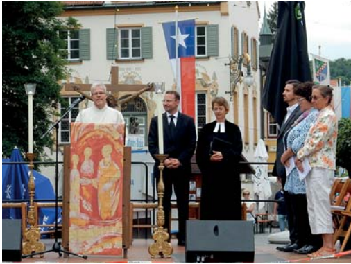
Ökumene in Fürstenfeldbruck: Ökumenischer Gottesdienst beim Altstadtfest am 23. Juli 2017

Reimers: Es gibt ganz unterschiedliche christliche Gemeindeformen. Wir haben neben den beiden großen Kirchen viele andere christliche Gemeinschaften und Gemeinden, die Freien Evangelischen Gemeinden zum Beispiel, die in Manchem wesentlich klarer und strikter sind als unsere beiden Kirchen. Wir verstehen uns immer noch als Volkskirchen, das heißt als Kirchen für Menschen in ihrer Vielfalt und in ihrer Pluralität. Auf unterschiedlichen Wegen mit ihnen zu leben und sie ansprechen zu können, sie bei ganz unterschiedlichen Themen zu begleiten und dies auf ganz unterschiedliche Weise, das macht uns letztlich auf lange Sicht als Kirchen miteinander aus. Wir bieten keinen engen Rahmen, an dem man sich zu orientieren hat. Andere Gemeinschaften bieten den engen Rahmen. Das ist auch wichtig, weil es Menschen gibt, die auf ihrem Weg als Christen genau das suchen und dies auch brauchen. Wir aber sind breiter, weiter, die evangelische wie die katholische Kirche, und haben andere Möglichkeiten, auch wenn wir in vielerlei Hinsicht auch klar sind, aber es ist weiter. Das macht einen