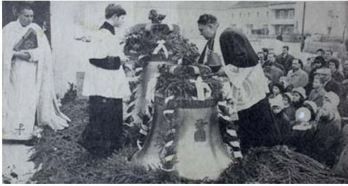
Glockenweihe am 13. November 1966

der, ob noch nie oder bis Ende der 1990er Jahre oder eben doch bis Sommer 2016 morgens zum Angelusgebet geläutet wurde.