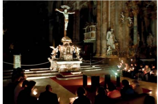
Ökumene in Fürstenfeldbruck: Lange Nacht der Christen am 31. März 2017 Schlussimpuls von St. Bernhard in der Klosterkirche Fürstenfeld

de der Konfessionen nicht interessieren, sondern er würde uns fragen: Was feiert Ihr miteinander? Das ist der Kern dessen, was Euch verbindet und was alles Trennende überwiegt!