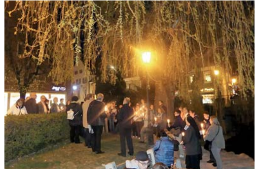
Ökumene in Fürstenfeldbruck: Lange Nacht der Christen am 31. März 2017 Impuls von St. Magdalena an der Leonhardikirche und an der Amperbrücke

miteinander Abendmahl gefeiert wird, da bin ich der letzte, der meinen Pfarrern sagt, das dürft ihr nicht tun, sondern der erste, der ihnen sagt: Tut es! Die Christen in den Gemeinden sehen, wieviel schon miteinander geht. Mittlerweile stellen sie die Frage: Was trennt Katholiken und Protestanten denn eigentlich noch?