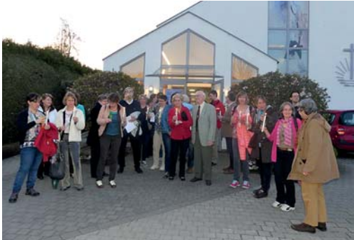
Ökumene in Fürstenfeldbruck: Lange Nacht der Christen am 31. März 2017 Startimpuls in der Neuapostolischen Kirche