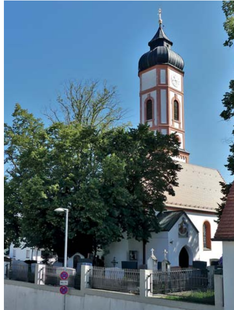
Die Edigna-Linde. Abb. links: Im Jahr 2012 mit vollem Blätterdach. Abb. rechts: Im Jahr 2017 mit kahlem Blätterdach

Die einzig hilfreiche Maßnahme, die befallene Linde vor dem langsam fortschreitenden Tod zu bewahren, wäre ein großzügiger Rückschnitt betroffener Areale, der sich jedoch insbesondere bei geschützten Bäumen schwierig gestalten kann. Wer ist zuständig für den Erhalt der Edigna-Linde? Grundsätzlich ist bei einem geschützten Baum zu differenzieren, ob er als Naturdenkmal ausgewiesen ist, oder ob er einer Baumschutzsatzung unterliegt. Bei durch Baumschutzsatzung geschützten Bäumen liegt die Verkehrssicherungspflicht zunächst beim Baumeigentümer, welcher nur in besonderen Fällen von dieser Pflicht befreit wird. Bei Naturdenkmälern dagegen obliegen Pflege und Verkehrssicherungspflicht in erster Linie dem Landkreis. Die Edigna-Linde ist zweifelsohne solch ein Naturdenkmal. Für Verkehrssicherungspflicht und Pflege ist also der Fachbereich Umweltschutz des Landratsamts zuständig. Nach