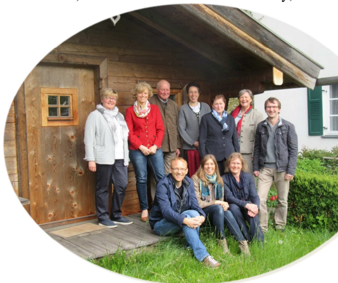
Unsere Oberneukirchner Wortgottesdienstleiter

Was wäre unser Pfarrverband ohne unsere vielen Ehrenamtlichen, die sich in allen Bereichen unserer Pfarrgemeinden engagieren! Es ist nicht selbstverständlich und neben der Notwendigkeit vieler Dienste, bereichert es das Pfarreileben. Eine One-Man-Show ist unser Pfarrverband sicher nicht. Darum wollen wir in den nächsten Pfarrbriefen Ehrenamtliche vorstellen, die kurz von ihrer Arbeit, oder nennen wir es lieber Hobby, erzählen.