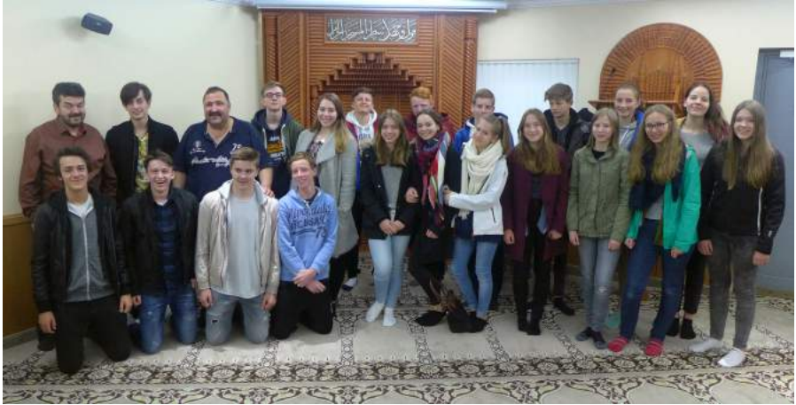
Firmlinge beim Besuch des Türkisch-Islamischen Kulturvereins in Al-lach (17. April 2016)