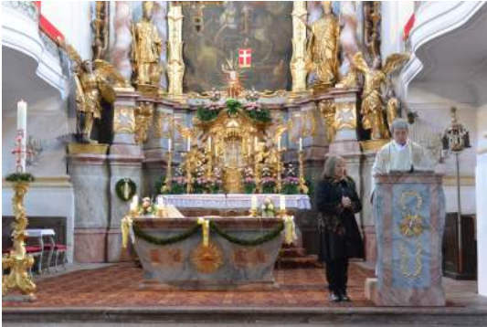
Ausflug nach Ruhpolding am 19.4.