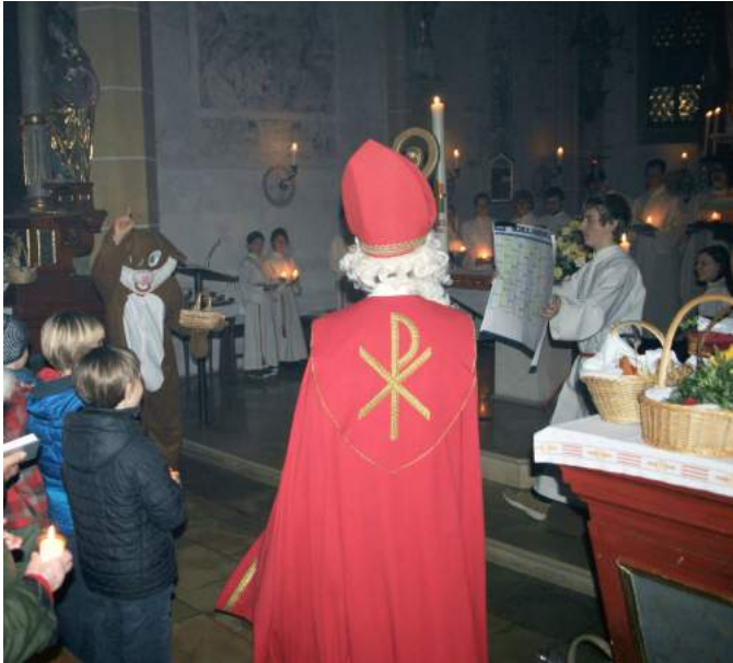
Osterlachen - der Osterhase vertreibt den Nikolaus