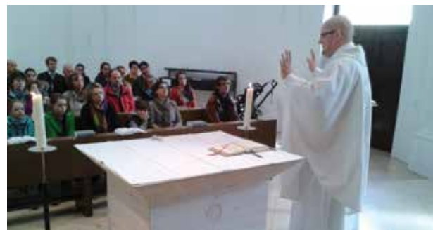
Einmal im Monat findet die „Messe für Ausgeschlafene“ in der Schmerzhafte Kapelle statt, die sich wachsender Beliebtheit erfreut.

zugezogene oder religiöse „Wiedereinsteiger“ – und eben für von der Arbeitswoche ermüdete Langschläfer. Beim letzten Schlag 12 sagte eine regelmäßige Kirchgängerin: „Ich kenne hier die Hälfte der Menschen nicht. Das finde ich gut!“ Die Möglichkeit zum Kennenlernen gibt es dann beim anschließenden Mittagessen in einem Restaurant in der Nähe. Ganz entspannt, ohne Voranmeldung, mal bayrisch, mal italienisch, mal asiatisch. Die nächsten Termine für Schlag 12 stehen schon fest. Denn das erste Jahr hat gezeigt: Ausschlafen, Glauben feiern und den Sonntag genießen, das geht sehr gut zusammen.