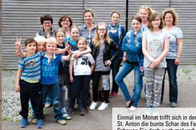
Einmal im Monat trifft sich in den Remisen von St. Anton die bunte Schar des Familienkreises. Schauen Sie doch auch mal vorbei (Termine auf S. 12)