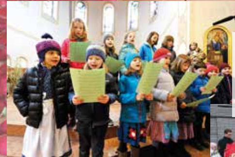
Palmsonntag im Pfarrverband: Mit Palmbuschen-segnung im Hof von St. Anton, Kinderchor in der Kirche und Palmesel Matthias, der auf dem Weg von St. Andreas zu lahmen anfang, weil er ein Rad verloren hatte. Mittlerweile ist er aber wieder genesen.