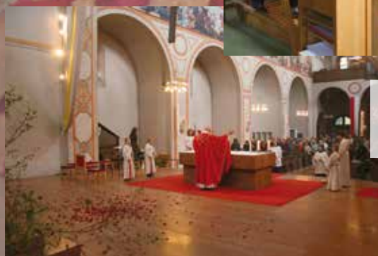
Auch heuer regnete es zu Pfingsten Rosenblätter im Gottesdienst in Erinnerung an die Feuerzungen des Evangeliums. Gestaltet wurde der Gottesdienst vom Kirchenchor des Pfarrverbands.