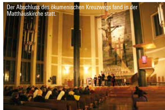
Der Abschluss des ökumenischen Kreuzwegs fand in der Matthäuskirche statt.