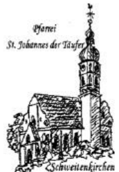
Pfarr- St. Johannes der Täufer Schweitenkirchen