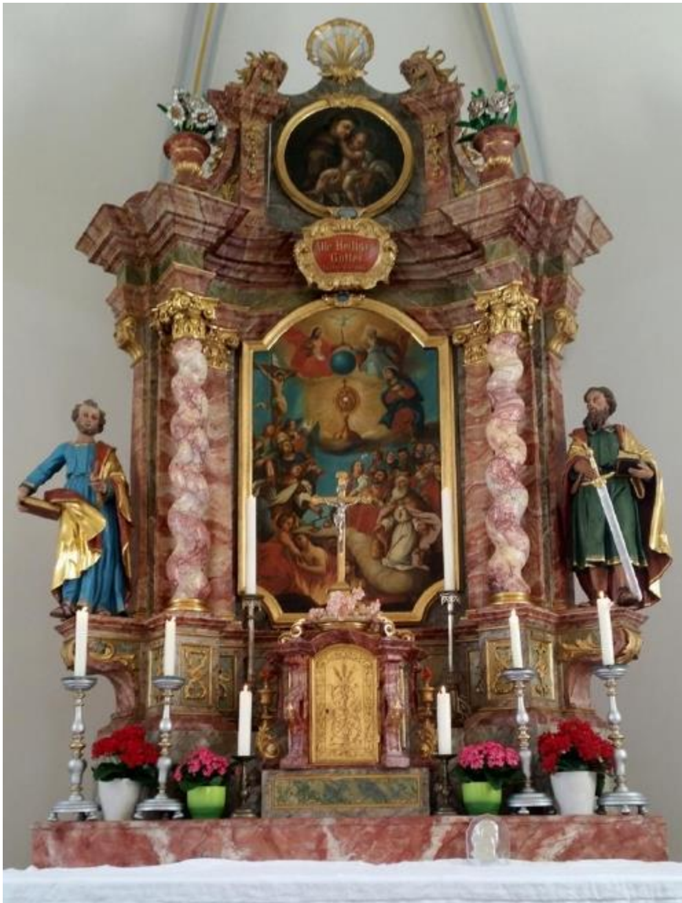
Hochaltar in der Ferialkirche St. Peter u. Paul, Ampertshausen