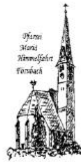
Pfarr- Haus Himmelfahrt Förnbach