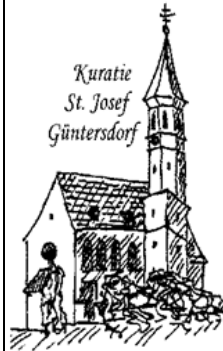
Kuratie St. Josef Güntersdorf