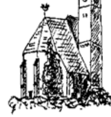
Pfarrei Maria Himmelfahrt Förbach