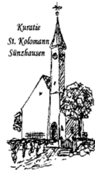
Kuratie St. Koloman Sänzhhausen

Internetseiten im Pfarrverband: www.erzbistum-muenchen.de/PV-Schweitenkirchen www.erzbistum-muenchen.de/Schweitenkirchen www.erzbistum-muenchen.de/MariaeHimmelfahrtFoernbach