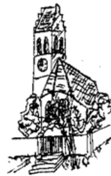
Kuratie St. Georg Dürnzhausen