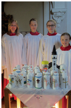
Über hundert Kerzen wurden gebastelt und an die Gläubigen gegeben.