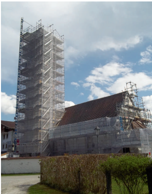
Die eingerüstete Kirche von NO

Zu den Hauptarbeiten werden noch weitere Firmen herangezogen, wie zum Beispiel der Steinmetz und Kirchenmaler Spengler.