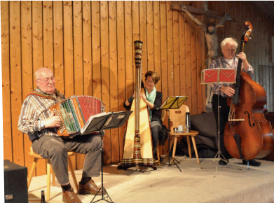
Die Musikanten spielen auf.

Weil sich die Lebensphase Alter immer stärker verbessert, gestaltet sich auch die kirchliche Arbeit sehr vielfältig. In der Arbeit mit alten Menschen gibt es in unserer Kirche bereits eine lange Tradition und einen großen Erfahrungsschatz. Doch besonders in der Gemeinschaft mit „jungen Alten“ wird deutlich, dass sich einiges erst noch weiter entfalten wird.