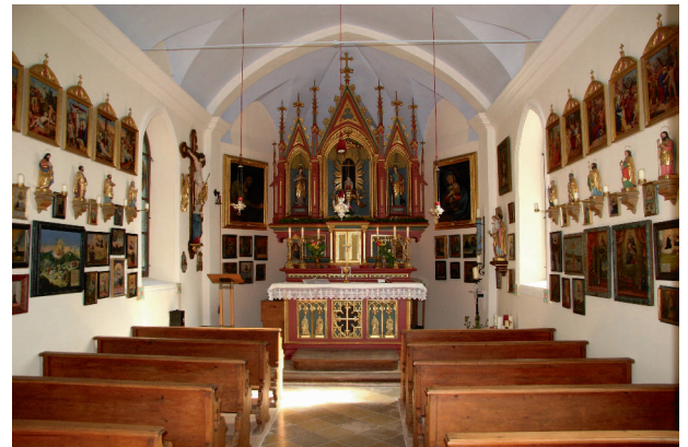
Das Innere der Nuslbergkapelle mit den Votivbildern

So könnte man im Jahr 2016 auf eine 500-jährige Wallfahrtstradition auf dem Nuslberg zurückgreifen.