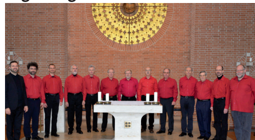
Die Sänger der Choral schola Unterschleißheim

Schon immer war der Gesang eine besondere Form des Gebetes. Bereits im Alten Testament wird von Sängern und Vorsängern berichtet. In der Zeit nach Christus werden vor allem die Psalmen vertont. Es entstehen verschiedenste Arten von Gesang. Immer sind sie einstimmig und mit einer einfachen Melodie. Die Hauptsprache war Latein. Im 6. Jahrhundert vereinheitlichte Papst Gregor I. diese Gesänge. Vor allem in den Klöstern wurde bei den Stundengebeten der Choral gepflegt. Waren es über Jahrhunderte nur mündlich überlieferte Melodien, so entwickelte sich um das Jahr 1000 eine schriftliche Form der Festlegung. Die Neumen sollten Betonungen und Akzente der Texte darstellen. Erst später kam auch die Notierung der Tonhöhe hinzu. Daraus entstand die noch heute übliche Notenschrift. Der Choral ist die Wiege der abendländischen Gesangskultur. Inzwischen werden Choräle, zum Teil mehrstimmig, auch in den Landessprachen gesungen. Insgesamt ist der Choral allerdings weitgehend aus den Gottesdiensten verschwunden. In Klöstern wird er noch öfter gepflegt. Vor mehreren Jahrzehnten hat sich in Unterschleißheim eine Choral schola gebildet. Seitdem erklingen dort in der Pfarrkirche Sankt Ulrich immer wieder diese Melodien.