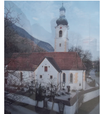
Die neue Farbgestaltung der Fassade

Die Firma Steilbau übernimmt die Erneuerungen und Ausbesserungsarbeiten im Dachstuhl und am Glockenturm. Die Reinigung der Dacheindeckung wird mit Hilfe der freiwilligen Feuerwehr Niederaudorf und sonstigen Helfern in eigener unentgeltlicher Weise vorgenommen.