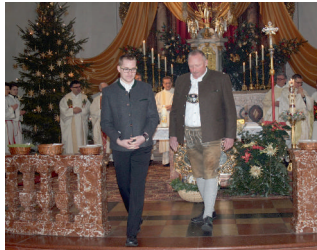
Am Ende des Gottesdienstes wurden Geschenke überreicht.