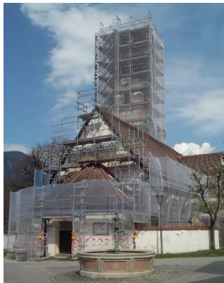
Blick von SO

Nach der Errichtung des Gerüsts durch die Firma Westermaier konnten nun die ersten Arbeiten an der Außenfassade vorgenommen werden. Es wurde nachgeforscht, welche Schäden zu beseitigen sind. Inzwischen wird bereits mit dem Auftragen einer speziellen Putzschicht begonnen, welche nach den Grundsätzen von historischen Gebäuden notwendig ist.