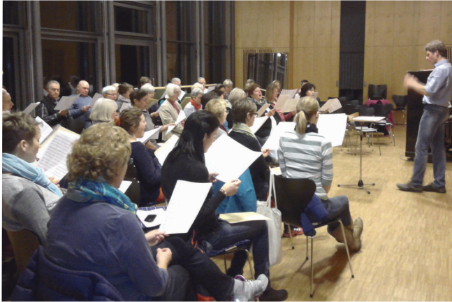
Eine der ersten Proben im Pfarrheim Kiefersfelden