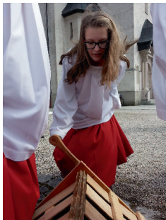
Beim "Ratschen" muss man sich anstrengen.

Die Osterzeit war bei den Ministranten wie jedes Jahr eine der erlebnisreichsten Zeiten im Kirchenjahr. Sieben Oster-Gottesdienste, drei Hauptproben und unzählige Dienste, die in dieser Zeit organisiert wurden. Doch wer mit Spaß an die Sache herangeht, meistert auch diese mit Bravur. Und so konnten wir auch dieses Jahr wieder ein schönes Osterfest feiern.