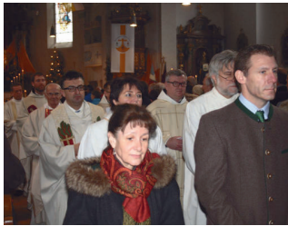
Ein feierlicher Auszug beendete das Pontifikalat.