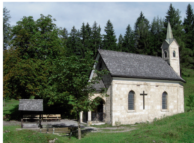
Die Kapelle auf dem Nulberg, eingebettet in die Landschaft

Um 1718 baut der Einsiedler Matthias Pichler die Kapelle. Eine durch die Pfarrgemeinde und den Vikar Thomas Perwein erbetene Messlizenz wurde von Freising abgelehnt. Dem frommen Zug der Zeit entsprechend und in Ermangelung eines geregelten Gottesdienstes wurde zur Privatandacht 1763 ein Kreuzweg eingesetzt. 1805 im Rahmen der Säkularisation befahl das Landgericht Fischbach den Abriss der Kapelle. Dies kam aber nicht zur Ausführung. Im Jahr 1849 wurde die Kapelle benediziert und die Erlaubnis zur Meßfeier erteilt. 1872/75 wird die Nulbergkapelle gemauert und 1875 erneut benediziert. Das im Altar zeigte kleine Vesperbild ist eine Barockstatue, die zwar 1805 entfernt, aber 1951 wieder feierlich zurückgebracht wurde. Die Votivbilder – das älteste Votivbild vom Jahre 1681 – stammen noch teilweise aus der hölzernen Kapelle und wurden durch neuere aus der Gegenwart vermehrt. Zum Eigentum der Kapelle gehört auch ein Kreuzpartikel, der mit einer Authentik vom 14.05.1775 von Frater Nikolaus Angelus Maria Landini aus Florenz, Weihbischof, der Kapelle geschenkt und im Tabernakel aufbewahrt wird.