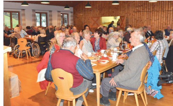
So gemütlich ist es bei den Senioren im Pfarrheim.