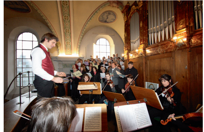
Musiker und Sänger bei der Feier der Pfarrverbandsgründung

Die Konzerte finden am Samstag, 8. Oktober 2016 um 19.00 Uhr, sowie am Sonntag, 9. Oktober 2016 um 18.00 Uhr in der Pfarrkirche Hl. Kreuz Kiefersfelden statt.