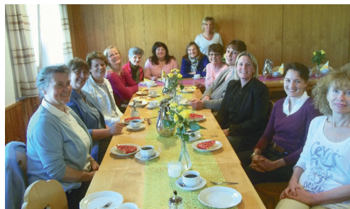
Die Pflegerinnen bei der Feier in Oberaudorf