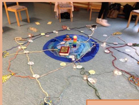
„Knüpfe mit mir am Netz des Lebens“ – Jesus beruft die Fischer am See – Wort Gottes Feier (Mt 4,18-22)