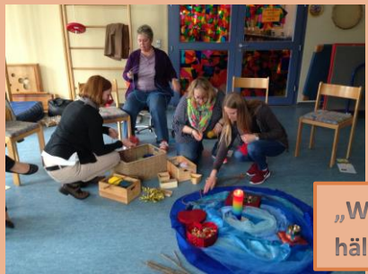
„Was mich trägt und hält in meinem Leben.“