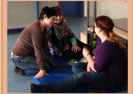
Unser Team ist ein Netz aus Beziehungen ...