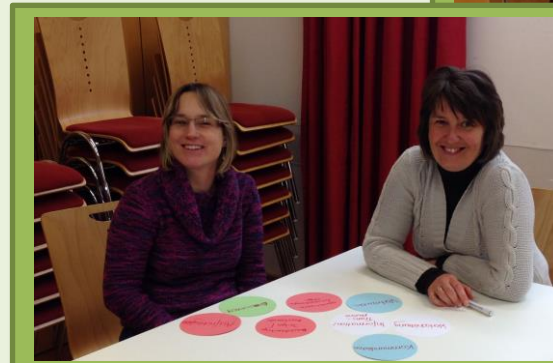
Austausch und Gespräch: „Was hilft uns, unser Netz tragfähig zu machen?“