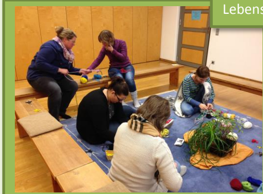
„Netzwerkarbeiten“ – mein Lebensnetz, das mich trägt ...