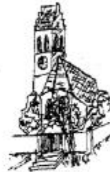
Kuratie St. Georg Dürnbach