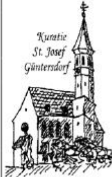
Kuratie St. Josef Güntersdorf