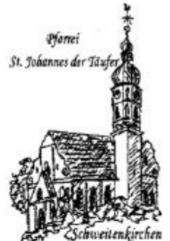
Pfarrei St. Johannes der Täufer Schweitenkirchen