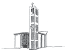
St. Thomas Morus