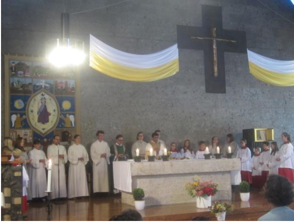
Einführung neue Ministranten Juli 2015