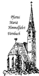
Pfarrei Maria Himmelfahrt Förbach