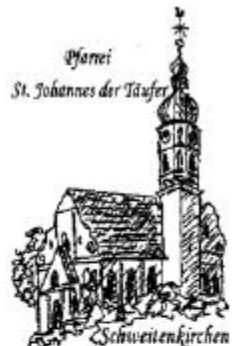
Pfarr- St. Johannes der Täufer Schweitenkirchen