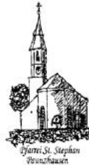
Pfarr- St. Stephanus Paunzhausen