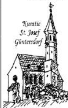
Kuratie St. Josef Güntersdorf