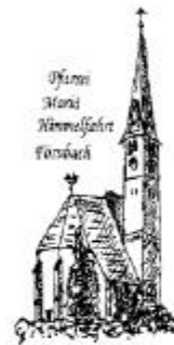
Pfarr- Haus Himmelfahrt Förnbach