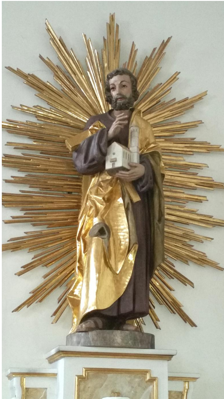
Hl. Josef in der Kirche Güntersdorf