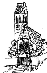
Kuratie St. Georg Dürnzhausen