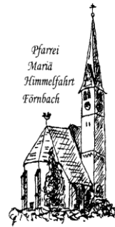
Pfarrei Mariä Himmelfahrt Förnbach