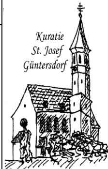
Kuratie St. Josef Güntersdorf