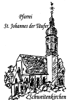
Pfarrei St. Johannes der Täufer Schweitenkirchen