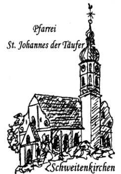
Pfarrei St. Johannes der Täufer Schweitenkirchen