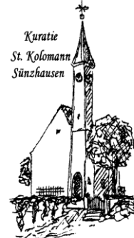
Kuratie St. Kolomann Sünzhausen

Internetseiten im Pfarrverband: www.erzbistum-muenchen.de/PV-Schweitenkirchen www.erzbistum-muenchen.de/Schweitenkirchen www.erzbistum-muenchen.de/MariaeHimmelfahrtFoernbach