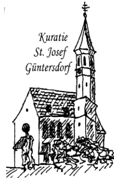
Kuratie St. Josef Güntersdorf