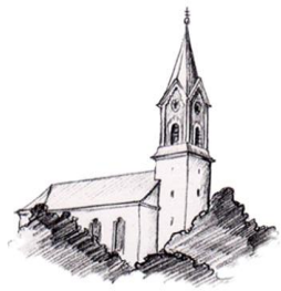
St. Johann Baptist, Attenkirchen