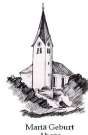
Maria Geburt Abens