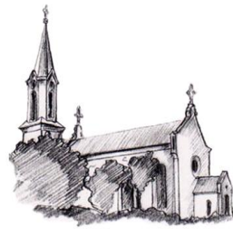
St. Peter, Wolfersdorf