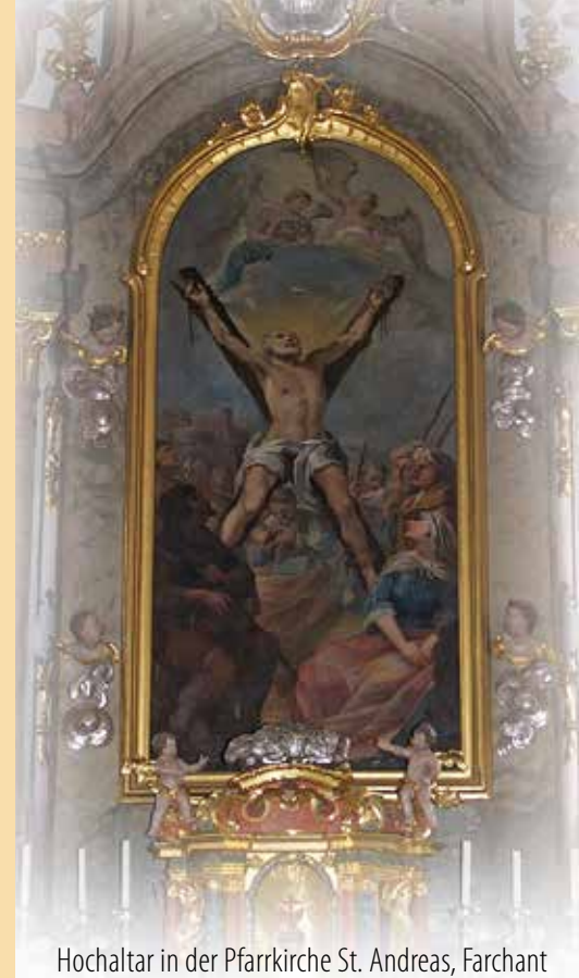
Hochaltar in der Pfarrkirche St. Andreas, Farchant

Von Glaubensfeinden wurde er wohl um das Jahr 60 in Griechenland getötet. Es heißt, man habe ihn an ein Kreuz genagelt, dessen Balken schräg übereinander genagelt sind – das Andreaskreuz.