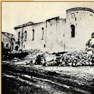
Bayerisches Hochland. Ruine der abgebrannten Kirche in Partenkirchen. 1865.