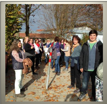
Innehalten – losgehen ...