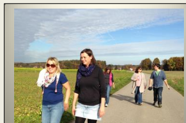
... miteinander in Ruhe auf dem Weg.