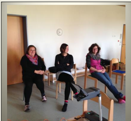
Das Team wahrnehmen – zur Ruhe kommen – Wünsche für den heutigen Tag.