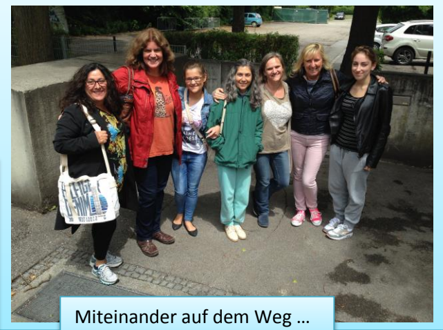
Miteinander auf dem Weg ...