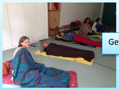
Gemeinsam die Stille hören, meditieren, betrachten