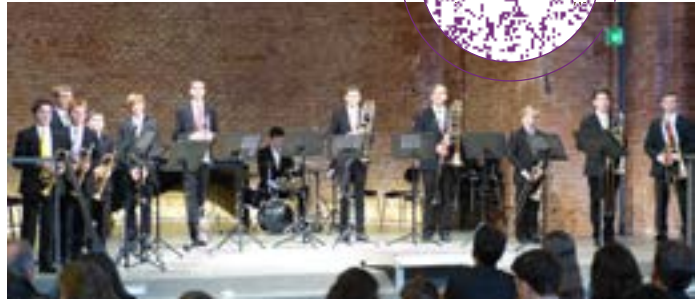
BRASSATTACCA in der Allerheiligenhofkirche

Weihnachtliche Bläsermusik mit BRASSATTACCA am 4. Adventssamstag ATTACCA ist das Jugendorchester der Bayerischen Staatsoper. Das Blechbläserensemble dieses Orchesters freut sich, Sie auf die weihnachtliche Festwoche einzu-