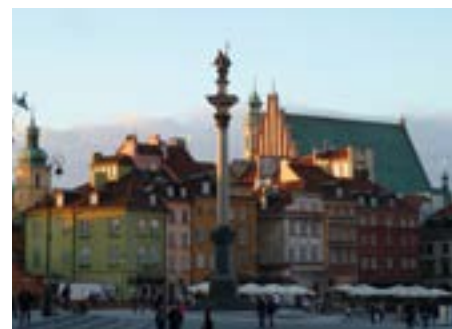
Altstadt von Warschau