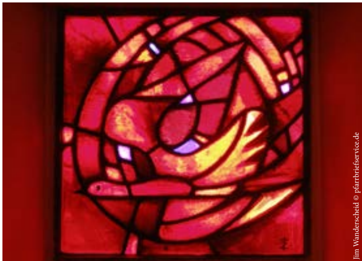
Jim Wanderscheid © pfarrbriefservice.de

Das Sakrament der Firmung wird voraussichtlich am 26.06.16 von Bischofsvikar Graf Rupert zu Stollberg gespendet werden.