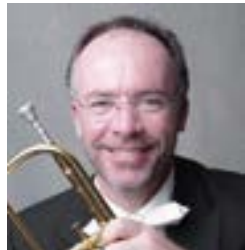
Leitung: Ralf Scholtes

stimmen mit einem Konzert am Samstag, den 19. Dezember 2015, direkt im Anschluss an die Vorabendmesse in der Pfarrkirche von St. Augustinus.