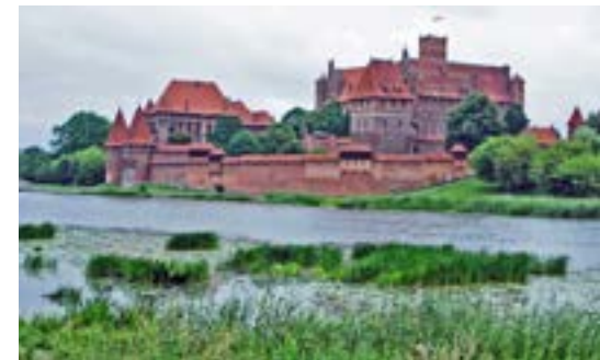
Marienburg – Residenz des Deutschen Ordens, 13. Jh. (UNESCO-Weltkulturerbe)