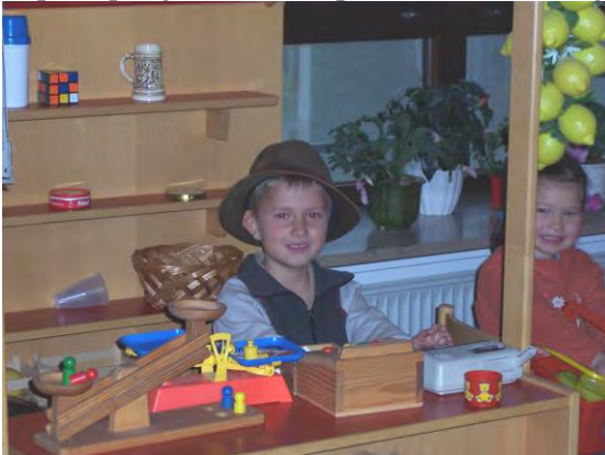
Sprachpflege und lebenspraktische Erfahrung