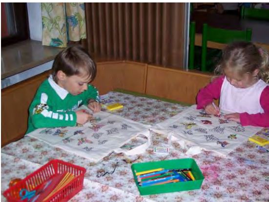
Kreativität und Feinmotorik