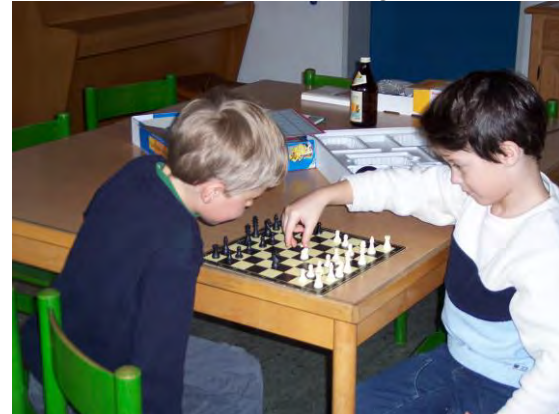
Konzentration und Strategie