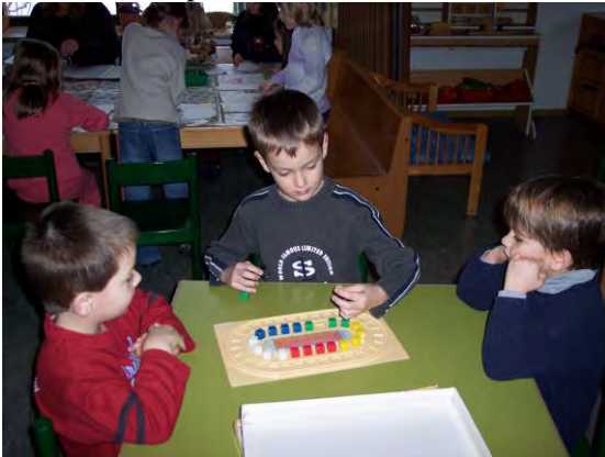
Soziale Kompetenz und Farbenlehre