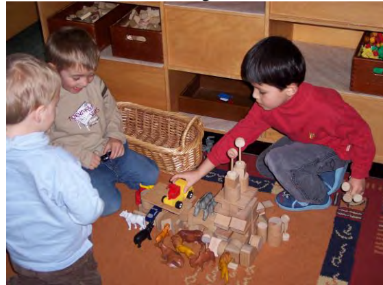
Konstruktionsfähigkeit und Motorik