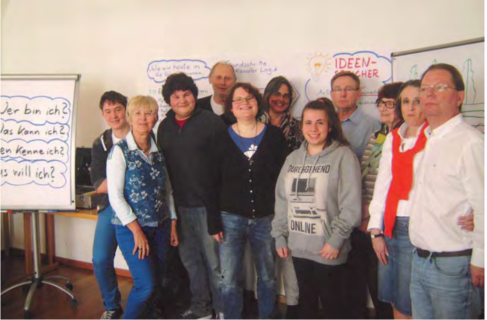
„Gipfeltreffen“ am Domberg: Pfarrgemeinderatsmitglieder und Interessierte diskutierten über die Zukunft in St. Hildegard