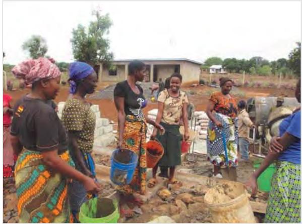
Packen selbst auf der Baustelle mit an: WEECE- Frauen beim Bau der neuen Schule