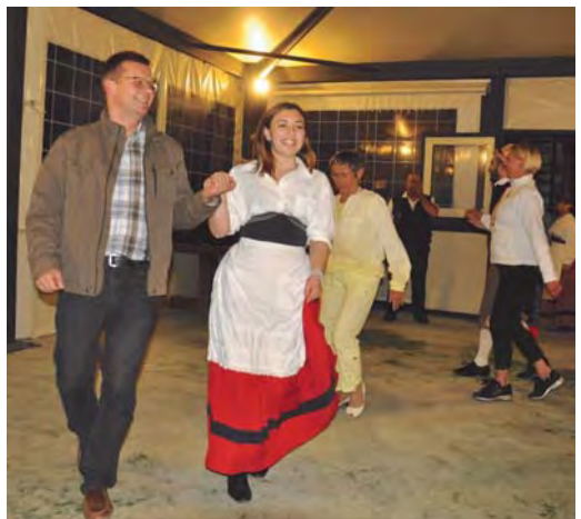
Saltarello-Tanzgruppe „Li Mazzamurelli“