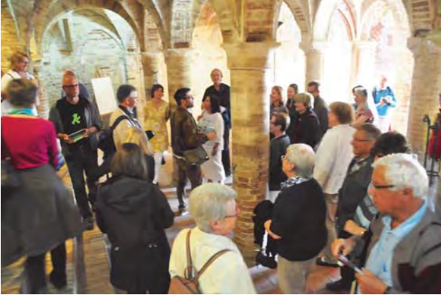
Die Unterkirche in „Santa Maria della Rocca“