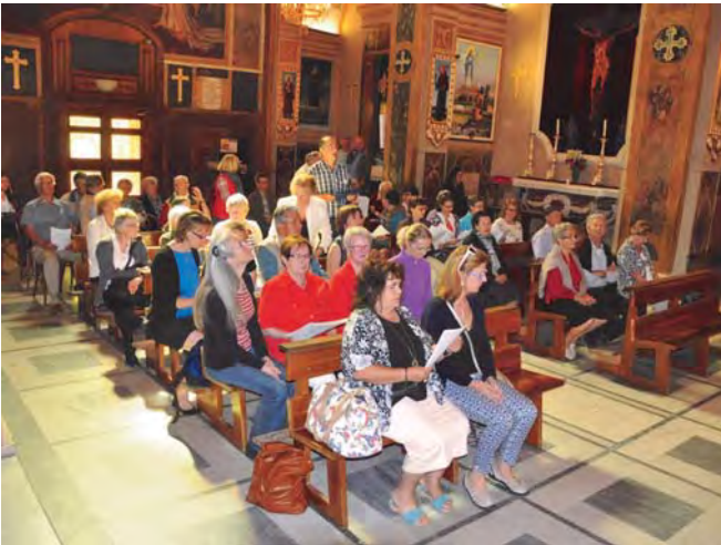
Madonna dell' ambro

Vier Tage, von Christi Himmelfahrt bis zum folgenden Sonntag, waren Mitglieder der Kirchenchöre Maria Schutz und St. Hildegard mit Angehörigen auf großer Fahrt in die italienische Provinz Marken. Nach der 800 km langen Anreise, mit einer längeren Pause in Bozen kam die Gruppe im idyllischen Hotel „La Ginestra“ in Montelparo an und wurde gleich mit einem Aperitif auf das abendliche Menü eingestimmt. Am Freitag stand ein Besuch des über 1000 Jahre alten Marienwallfahrtsortes „Madonna dell' ambro“ in den sybillinischen Bergen auf dem Programm. Dort gestaltete der Chor spontan die Wallfahrtsmesse.