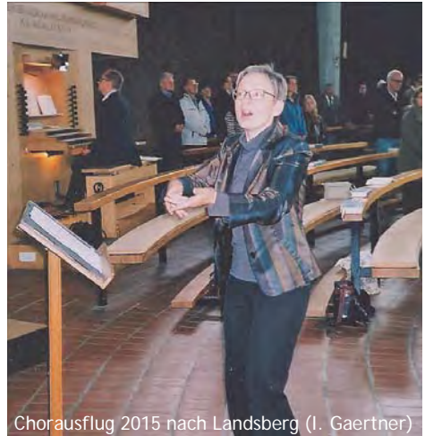
Chorausflug 2015 nach Landsberg