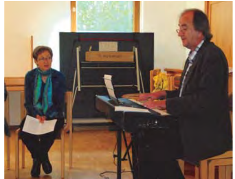
Familien-Musik-Wochenende in Aschau