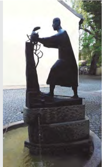
◀St. Emmeram, ▲Der gute Hirte

Abfahrt: 10.00 Uhr Kirchplatz Maria Schutz 10.10 Uhr St. Hildegard, Paosostr. Gegen 14 Uhr sind wir zu einer gemütlichen Kaffeestunde ins Pfarrheim St. Emmeram eingeladen. Rückkehr nach Pasing gegen 17 Uhr.