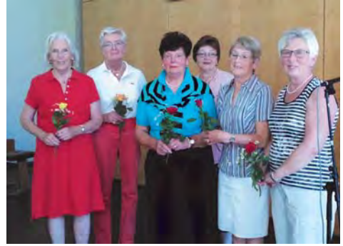
Helferinnen und Gratulations-Team