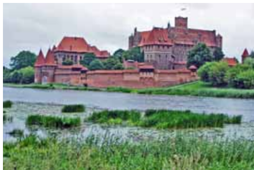
Marienburg – Residenz des Deutschen Ordens, 13. Jh. (UNESCO-Weltkulturerbe)

Informationen und Anmeldung ab Oktober 2015 in den Pfarrbüros.