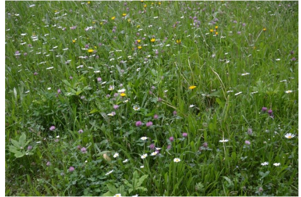
Eine Blumenwiese in der Region: Hier ist die Umwelt gesund, weil die Menschen auf sie achten.

den Vorgänger, die er häufig zitiert, schließt die Sorge um die Schöpfung die Sorge um den Menschen mit ein. Beides ist untrennbar miteinander verbunden. Damit steht die Enzyklika quer zu den gängigen politischen Zuschreibungen von „rechts“ und „links“, von „konservativ“ und „progressiv“. Es wird spannend sein zu sehen, wer sich in Zukunft in welchen Zusammenhängen auf den Papst berufen wird.