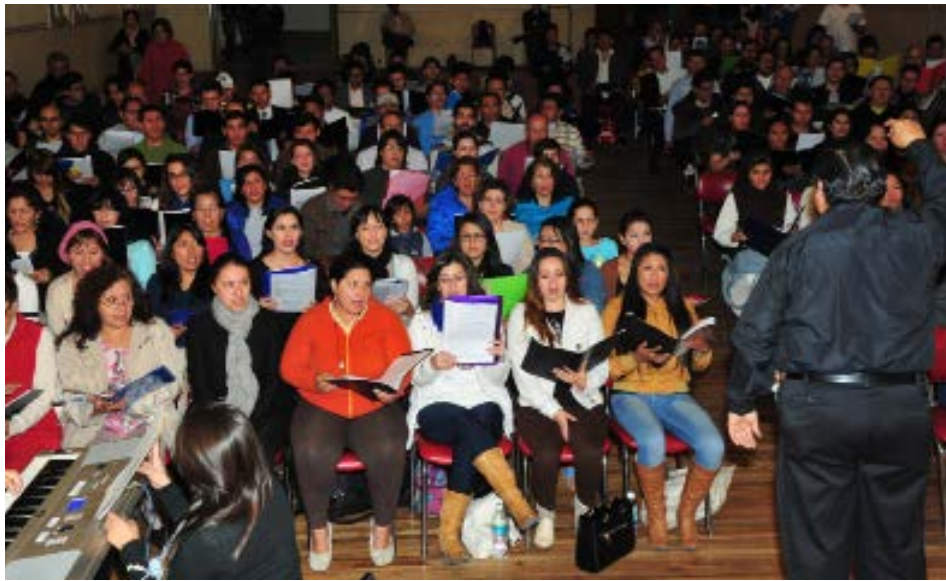
Für die Papstmesse wird fieberhaft geprobt. 200 ChorsängerInnen bereiten sich auf den Auftritt vor.

Fußweg dorthin. In dieser Eucharistiefeier darf ich als Vertreterin der Partnerschaft zwischen der Erzdiözese und der hiesigen Kirche beim Gabengang dabei sein und die Gabe „Partnerschaft“ zum Altar Tragen. Und das naturfrisch in bayrischer Tracht, mit einem meiner Dirndl darf ich unserem Heiligen Vater entgegen treten, was für mich eine ganz besondere Ehre ist.