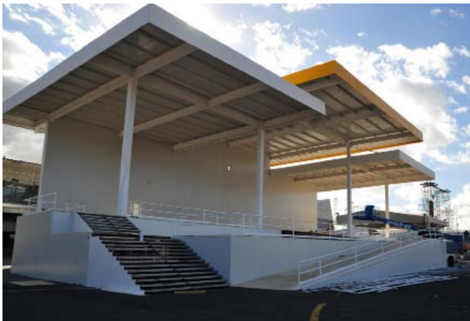
Die Altarinsel für die Papstmesse entsteht.