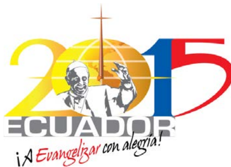
Logo für den Papstbesuch Juli 2015