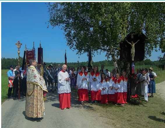
Flurumgang in Hohenschäftlarn

Dekanatswallfahrt ins Kloster Schäftlarn; Prozessionen aus Pfarreien des ganzen Dekanats