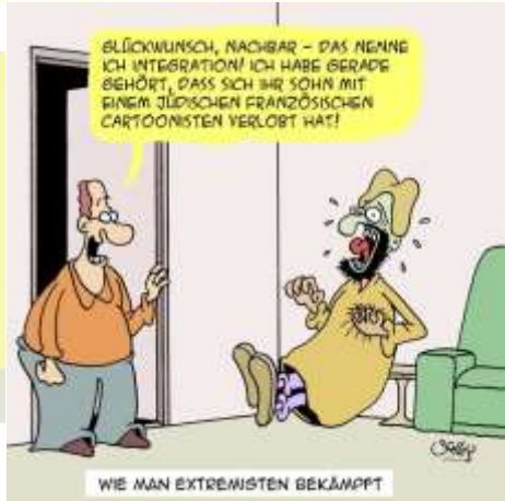
WIE MAN EXTREMISTEN BEKÄMPFT