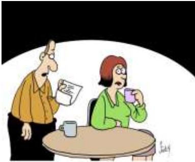
"ICH HABE EIN BETET GESPROCHEN, DAS ERHÖRT WURDE, UND NUN SAGT DAS FINANZAMT, ICH MUSS DAS ALS STEUERPFLICHTIGEN GEWINN ANGEHEN?"