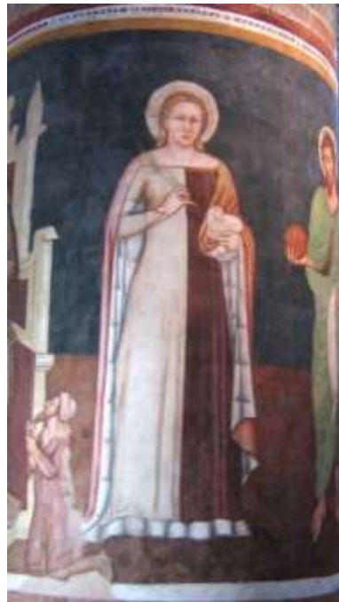
Hl. Agnes, Kirche San Nicolò in Treviso