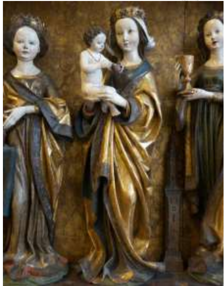
Ausschnitt vom „alten“ Untermentzinger Altar im Bayerischen Nationalmuseum

Die Ernte-Dank-Feier findet dieses Jahr am Donnerstag, den 1. Oktober statt.