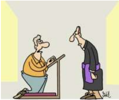
"BETEN? ICH?? ABER NEIN, HERR PFARRER! ICH HABE NUR EIN RUHIGES, SCHATTIGES PLÄTZCHEN GESUCHT, UM MEIN SMARTPHONE ZU NUTZEN?"