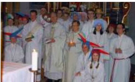
Osterscherz der Minis 2015