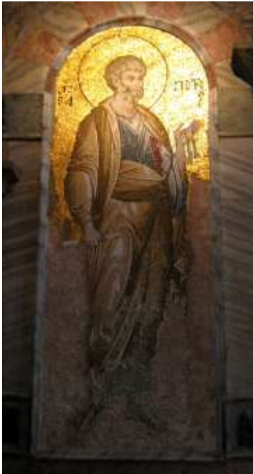
Hl. Petrus, Chora-Kirche in Istanbul

erscheint der Nimbus oder auch die Gloriolen dann mit einem einbeschriebenen Kreuz.