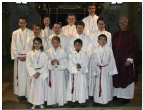
Neue Minis mit Paten und Ausbildern