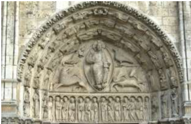
Christus in der Mandorla umgeben von Evangelisten-symbolen am Portal der Kathedrale von Chartres

Christus hat die Pforten des Totenreichs überwunden und zieht die Verstorbenen an sich. „ Hinabgestiegen in das Reich des Todes “ wie wir im Glaubensbekenntnis beten.