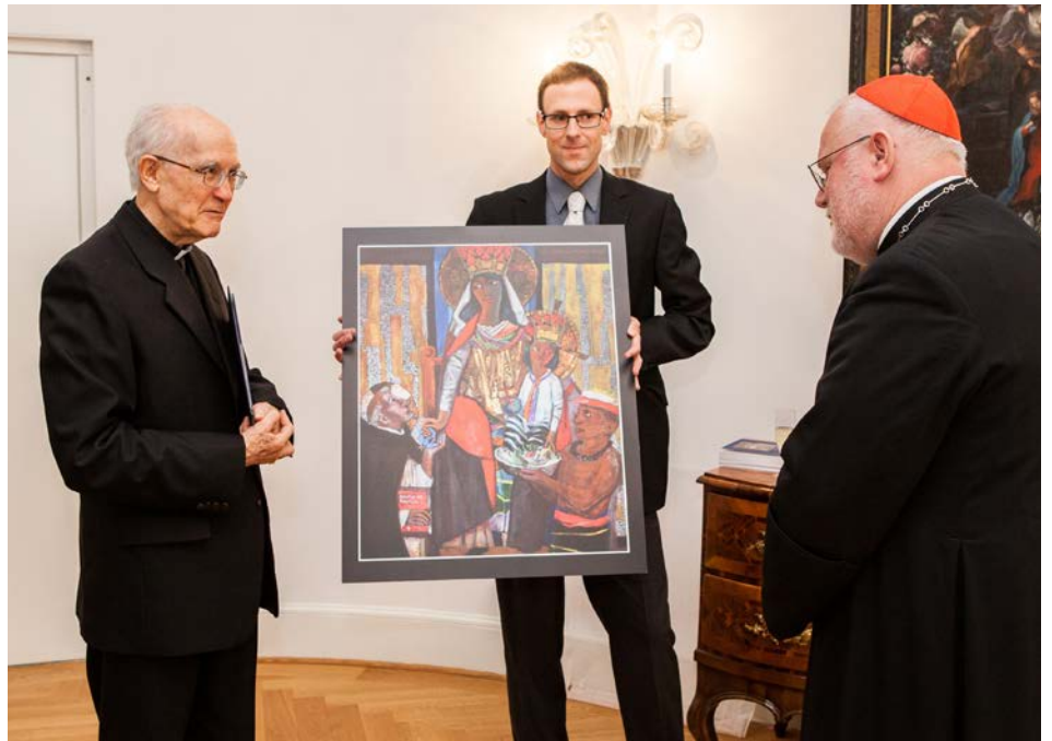
Übergabe des Gnadenbildes aus der Stadt Santo Domingo de los Tsáchilas