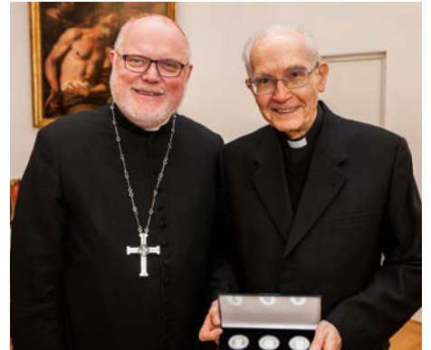
Freundschaftliches Treffen im Erzbischöflichen Palais: Kardinal Marx (links) und Bischof Terán.