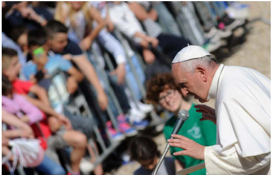
Die Erwartung in Ecuador ist groß. Welche Nachricht wird Papst Franziskus an das Volk richten?