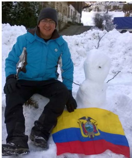
Schnee war eine ganz neue Erfahrung!

Mir gefällt das Leben im Dorf, weil man die Natur achtet, so kann ich die grünen Wiesen, saubere Flüsse sehen, wo man auch fischen kann. Die Natur ist sehr wichtig für die Deutschen, sie sind sehr freundlich und Spaßmacher,