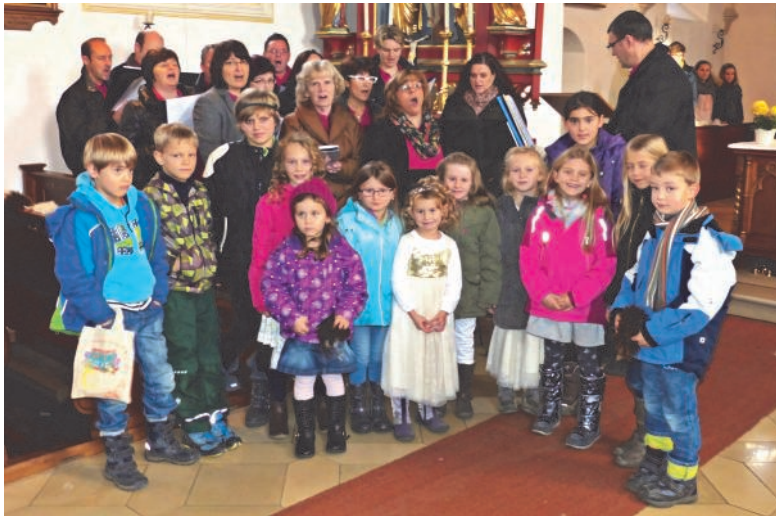
Die Kinder nach der Aufführung gemeinsam mit dem Orthofener Chor

Gäste der umliegenden Nachbarortschaften zu einem gemütlichen Beisammensein „Beim Wirt“ gleich neben der Kirche eingeladen. Dort wurden Plätzchen, Kuchen, Stollen, Glühwein und Kaffee kostenfrei angeboten. Stattdessen wurde um Spenden für die Caritas gebeten.