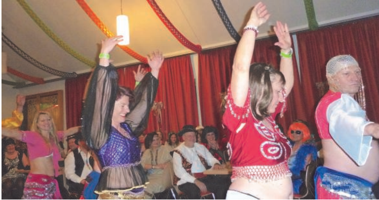
Die Bauchtanzgruppe des Pfarrgemeinderats

So wie der Pfarrerball im Odelzhausener Fasching bereits Tradition geworden ist, so wird dort auch mit Spannung die Einlage des Pfarrgemeinderates erwartet. Dieses Jahr waren am