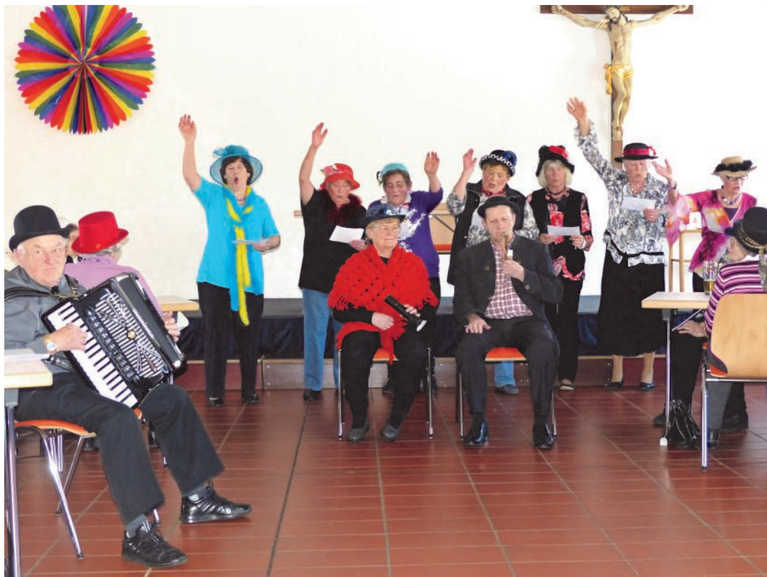
Das Lied vom Paprika

Ein Höhepunkt ganz anderer Art war der Krankengottesdienst in St. Benedikt, der in dieser Form nun schon fast seit dreißig Jahren stattfindet und zu