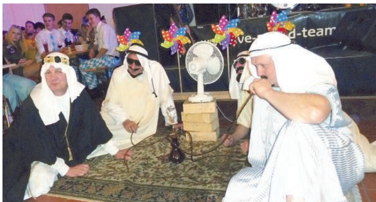
Die vier Scheichs debattieren über den Windpark

24. Januar vier Ölscheichs zu Gast, die sich als Besitzer der Windräder im Windpark zu erkennen gaben. Leider waren sie mit den Windverhältnissen in Odelzhausen nicht zufrieden und haben letztendlich die Windräder dem