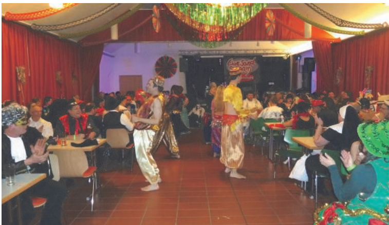
Tolle Stimmung beim Auftritt der Bauchtanzgruppe