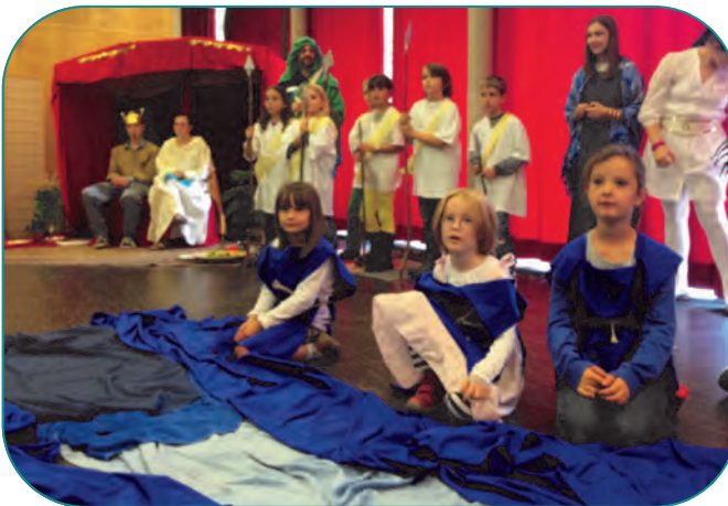
Kinder am Nil

Unterm Strich war der Kinderbibeltag 2014 mit dem Moses-Bibelspiel ein großer Erfolg und ein Spaß für alle Teilnehmer - Kinder, Jugendliche und Erwachsene. Wir freuen uns schon auf nächstes Jahr!