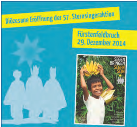
Grafik/Plakat: Erzbischöfliches Jugendamt München-Freising

Erstmals waren im Vorjahr auch in Maria Schutz Sternsinger unterwegs. Zwei Gruppen hatten sich gefunden, die so viele Haushalte wie möglich besuchten, aber leider nicht alle Besuchswünsche erfüllen konnten. In St. Hildegard, das schon eine lange Sternsinger-Tradition hat, waren ebenfalls wieder mehrere Gruppen unterwegs.