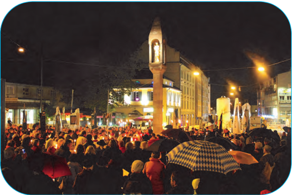
Weitere Fotos unter www.pfarrverband-pasing.de