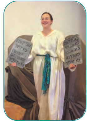
Moses verkündet die Zehn Gebote