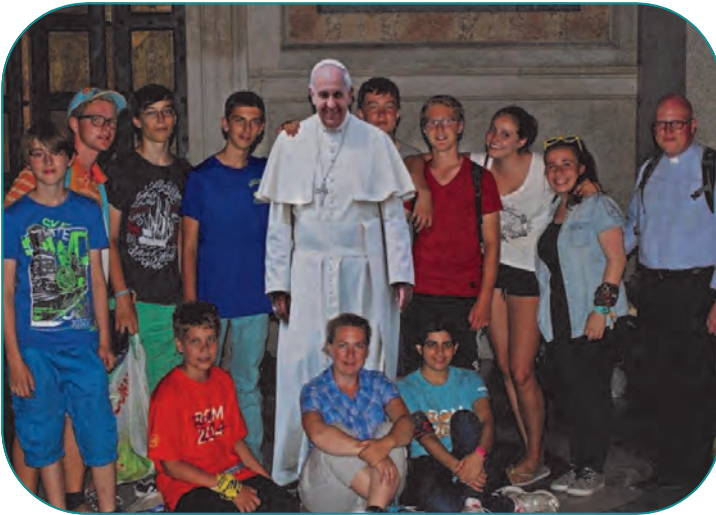
Ein Papst zum Anfassen? Echt oder Pappe?

Vom 2. bis 8. August fand die deutschlandweite Ministrantenwallfahrt nach Rom statt. Auch aus Pasing machten sich Ministranten -zusammen mit einer Gruppe der Stadtkirche Germering- auf den Weg in die ewige Stadt. Alle Teilnehmer schrieben je einen Artikel für ein Reisetagebuch. Diese sind im Folgenden stark gekürzt wiedergegeben.