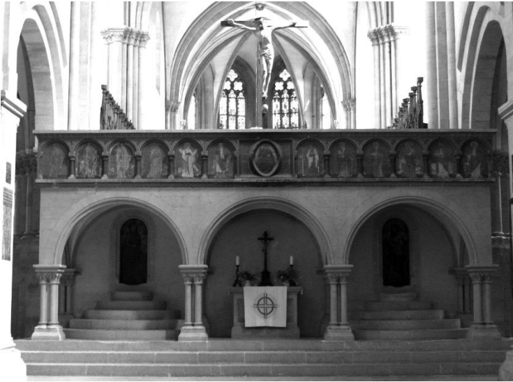
Lettner im Naumburger Dom

Die Verkündigung erfolgte jetzt von Ambo und Kanzel aus.