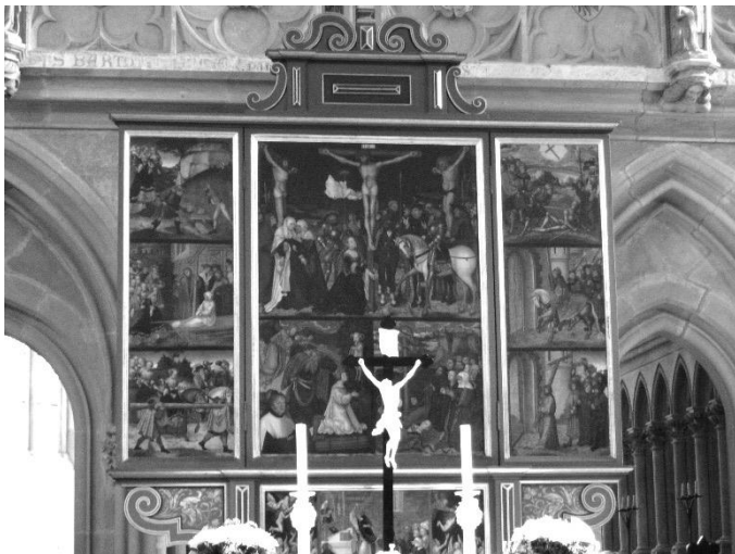
Kreuzaltar am Lettner im Dom von Meißen