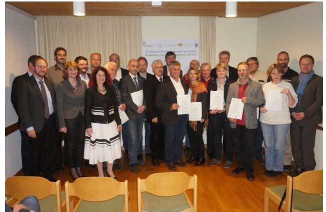
Bei der Verleihung der Urkunden.

Zudem wurde die Pfarrei Zu den Heiligen Schutzengeln in Eichenau erneut zertifiziert.