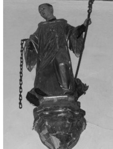
Leonhard-Statue gegenüber dem Hochaltar in Ramerberg