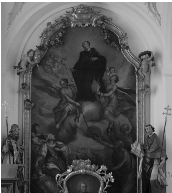
Leonhard-Altar in Rott

Der Heilige Leonhard ist Patron für alle Anliegen der Bauern und des Viehs, der Gefangenen, der Wöchnerinnen, für eine gute Geburt, gegen Kopfschmerzen, Geistes- u. Geschlechtskrankheiten.