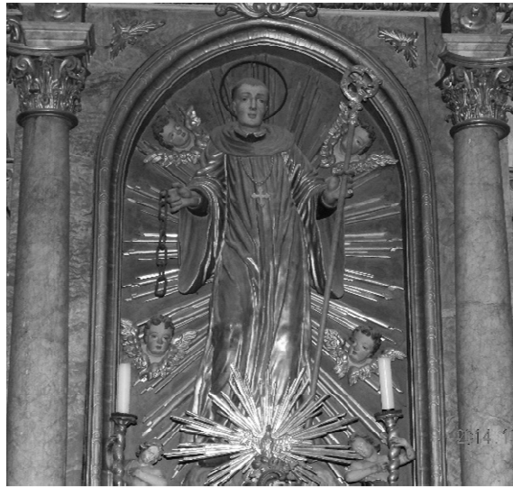
Leonhard-Statue am Hochaltar in Ramerberg

eines Bistums verweigerte er, blieb einfacher Diakon und zog sich in die Einsamkeit des Waldes Pauvin bei Limoges zurück, predigte von seiner Zelle aus und half den zu ihm kommenden Bedürftigen. Regelmäßig besuchte er Gefangene und erreichte für viele bei König Chlodwig (oder Chlotar I.) ihre Freilassung. Viele Gefangene riefen auch den Namen Leonhards, worauf sofort ihre Fesseln abfielen, die sie dann als Freie dem Einsiedler brachten. König und Königin zogen eines Tages zur Jagd in diesen Wald; Leonhard hörte die Königin klagen und rufen, da sie in Wehen lag. Auf Bitten des Königs betete Leonhard am Lager der Königin, und sie schenkte ihrem Knaben das Leben. Der König wollte Leonhard mit Gold und Silber beschenken, dieser bat aber nur um so viel Waldgelände, wie er mit seinem Esel in einer Nacht umreiten könne. Leonhard gründete in seinem Waldstück die Gemeinschaft von Noblat – das heutige Dorf St.Léonhard-de-Noblat-, wo er ehemalige Gefangene aufnahm und zu Handwerkern ausbildete.