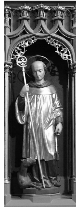
Leonhard-Statue in Griesstätt

Leonhard leitete die Gemeinschaft bis zu seinem Tod und wurde bald schon als heilig verehrt. Leonhards Existenz ist historisch nicht gesichert. Die älteste Lebensgeschichte wurde um 1030 verfasst. Seine Verehrung verbreitete sich rasch in Frankreich, England, Italien und besonders in Bayern und Österreich. Leonhard galt ursprünglich als Schutzpatron derer, die in Ketten liegen, also der Gefangenen aber auch der Geisteskranken, die man bis ins 18. Jahrhundert ankettete; nach der Reformation wurde er Schutzpatron der Haustiere, weil man die Ketten, mit denen er abgebildet wurde als Viehketten deutete. Im 19. Jahrhundert erreichte die Verehrung in Bayern ihren Höhepunkt. Man nannte ihn den bayerischen Herrgott oder Bauernherrgott. In Bayern gehört Leonhard auch zu den 14 Nothelfern. Am Leonharditag werden Tiersegnungen vorgenommen und es finden viele Leonhardi-Ritte statt.