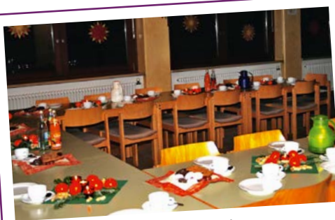
Ministranten-Weihnachtsfeier am Fr, 19.12.14, 17:00 Uhr