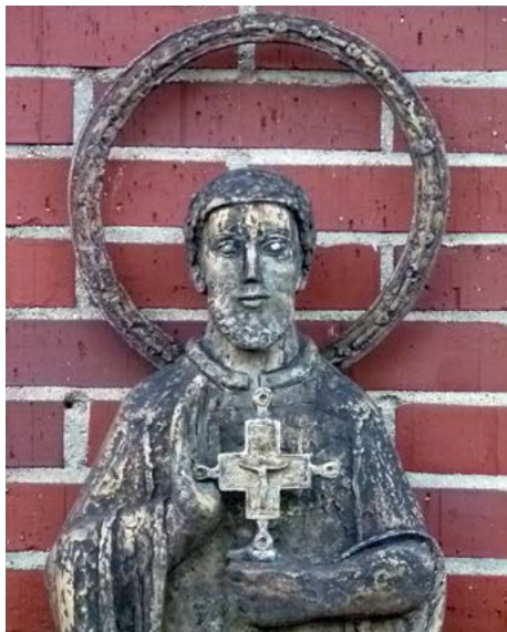
St. Franz Xaver Statue an unserer Kirche (Künstlerin: C. Stadler)

Am Samstag, 6.12.14, feiern wir unser Patrozinium „St. Franz Xaver“. Dieser Festgottesdienst um 18:00 Uhr wird vom Kirchenchor mitgestaltet.