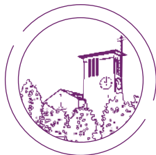
Logo St. Augustinus

Wir hoffen, dass es uns gelingt, Sie auch auf die Aktivitäten der Nachbargemeinde neugierig zu machen. Sollte ein Beitrag nur für eine Gemeinde relevant sein, haben wir diesen mit einem Logo gekennzeichnet: