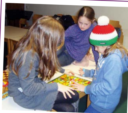
Ministranten-Adventswochenende vom Fr, 12.12.14 bis So, 14.12.14