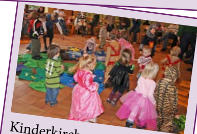
Kinderkirche am 08. Februar Kinder können mit Masken in den Pfarrsaal St. Augustinus kommen.