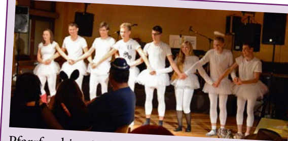
Pfarrfasching in St. Augustinus am 06. Februar Livemusik mit den Inn-Sider , Auftritt der Faschingsgesellschaft Gleisenia und die Maniacs ; Pfarrsaal St. Augustinus