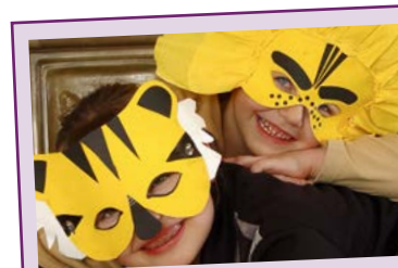
Für die Kinder der 1. bis zur 4. Klasse am Freitag, 30. Januar , Pfarrsaal St. Augustinus