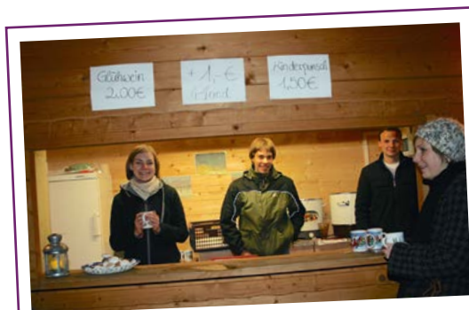
Verkauf von Kinderpunsch und Glühwein nach den Gottesdiensten an Heilig Abend