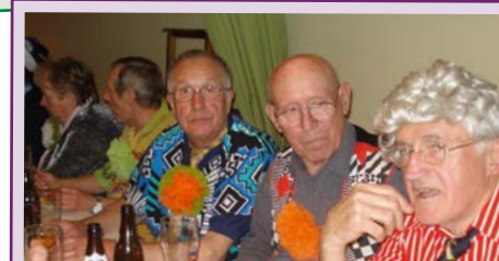
Der Unsinnige Donnerstag 12. Februar mit der kfd und der KAB im Pfarrsaal St. Augustinus

Die näheren Einzelheiten entnehmen Sie bitte unseren weiteren Publikationen.