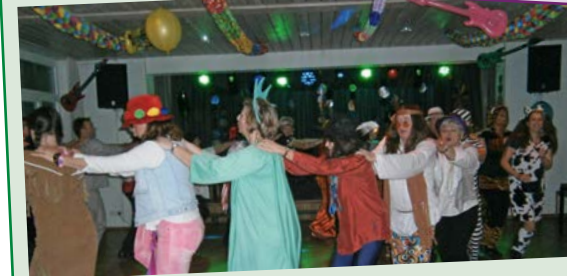
Pfarrfasching in St. Franz Xaver am 07. Februar Livemusik mit der Showband Party Time Auftritt der Faschingsgesellschaft Feringa Pfarrsaal St. Franz Xaver