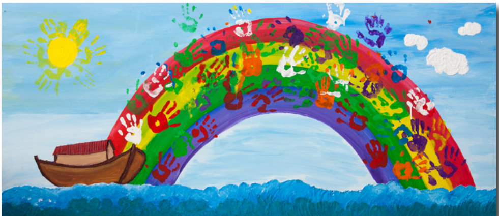
Der Regenbogen als Zeichen der Hoffnung und Verbindung zwischen Himmel und Erde