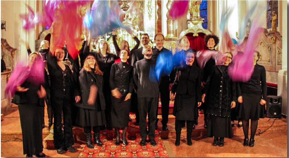
Gospelchor „Spirit of St. Paul“ in der Pfarrkirche St. Erhad