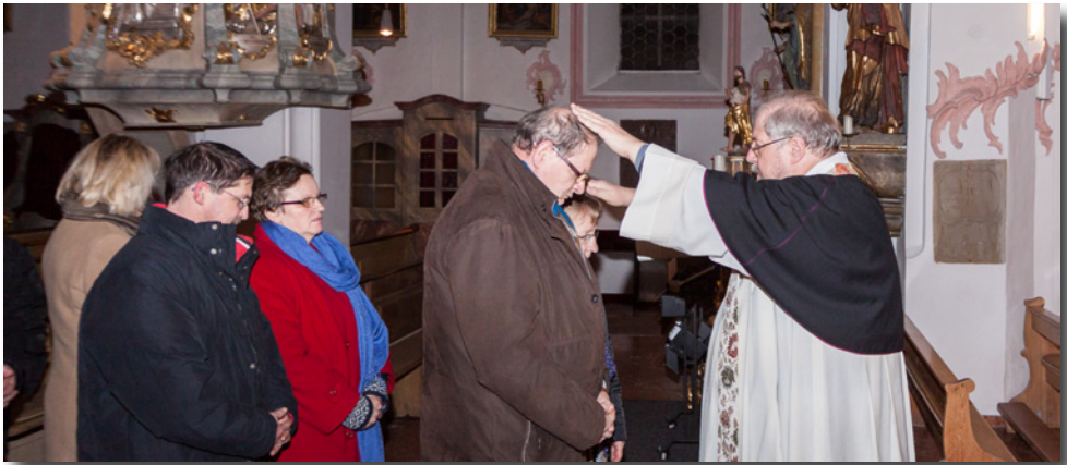
Paarsegnung in der Pfarrkirche St. Erhard