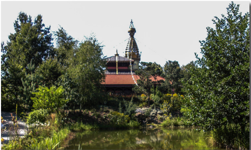
Nepal-Himalay-Pavillon in Wiesent