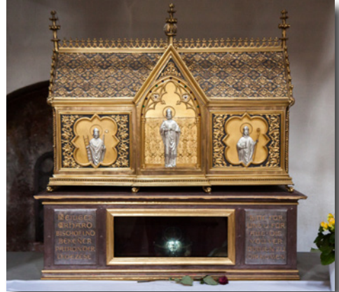
Der Schrein des Hl. Erhard in der Niedermünsterkirche zu Regensburg