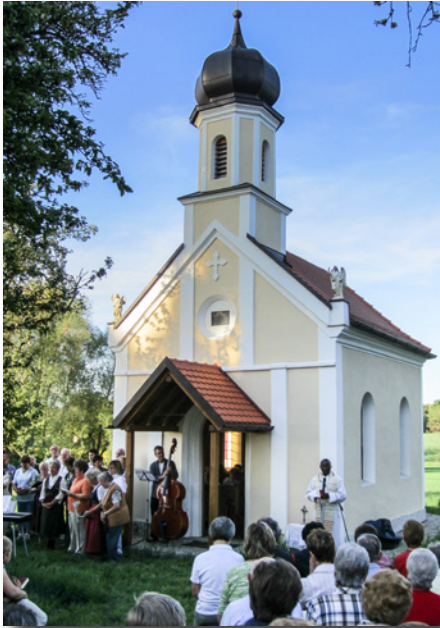
Kapelle in Rottman

Am Donnerstag, 10. Mai 2012 haben die Pfarreien Hörlkofen, Wörth und Walpertskirchen zu einer gemeinsamen Maiandacht bei der Kapelle in Rottmann eingeladen.