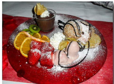
Liebevoll dekorierte Nachspeise