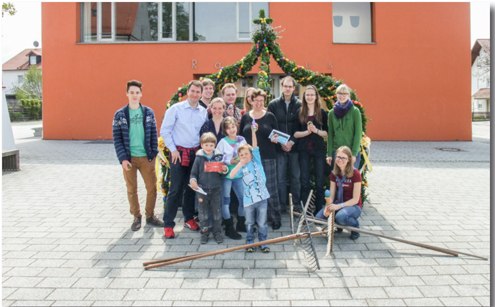
Beim Oarschein in Hörlkofen hatten wieder alle sichtlich Spaß