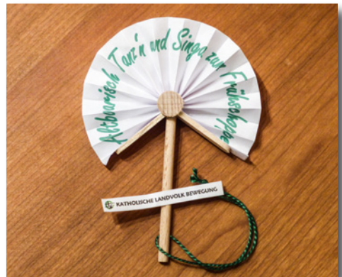
Das Tanzzeichen zum Volkstanz