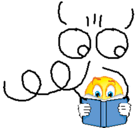
Bücherwurm Lesepaten