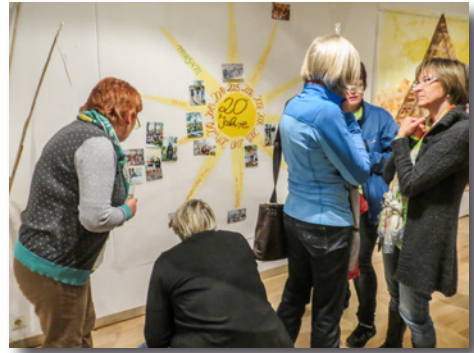
Bei der Vorbereitung des Bibeltags