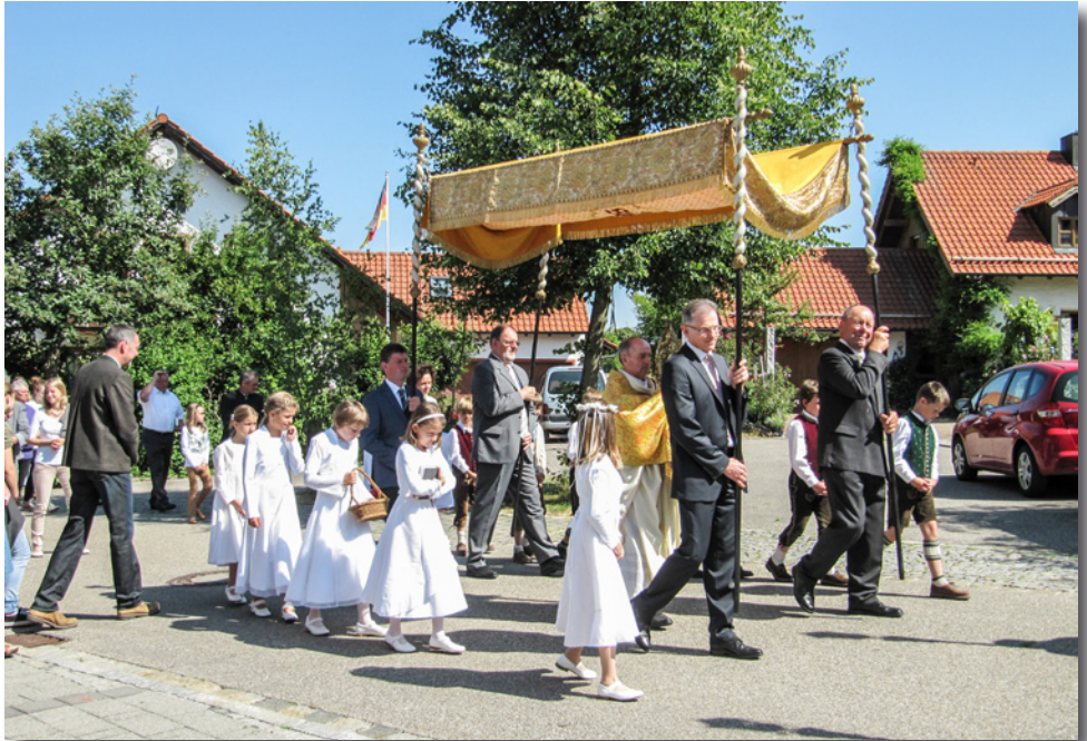
Fronleichnamsprozession in Würth

Das Fronleichnamsfest ist für uns Christen eine Demonstration der besonderen Art. Am Hochfest des Leibes und Blutes Christi ziehen wir mit Gebet und Gesang und Musik