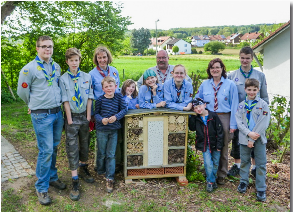
Stolz präsentieren die Pfadfinder ihr Insektenhotel

Die Biber und Wichtel/Wölflinge sammelten in dieser Zeit Materialien, um die verschiedenen Abteile des Insektenhotels zu befüllen. Gemeinsam machte man sich an