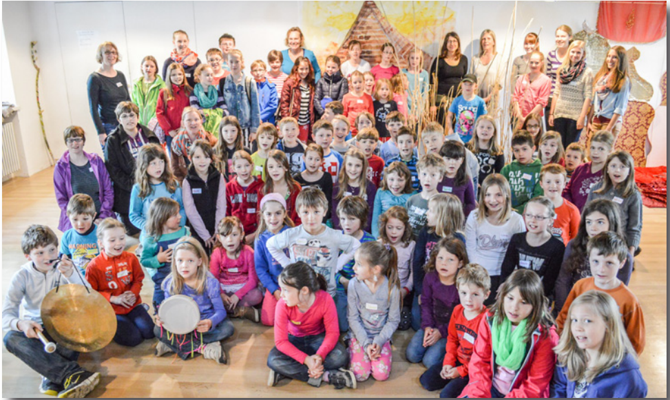
Teilnehmer und Organisationsteam Kinderbibeltage Wörth