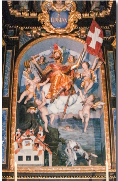
Altarbild in der Nebenkirche St. Florian, Schwabersberg