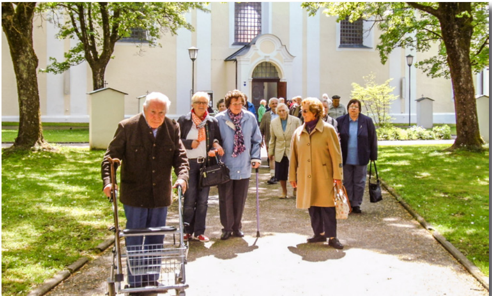
Wallfahrtskirche Maria Dorfen