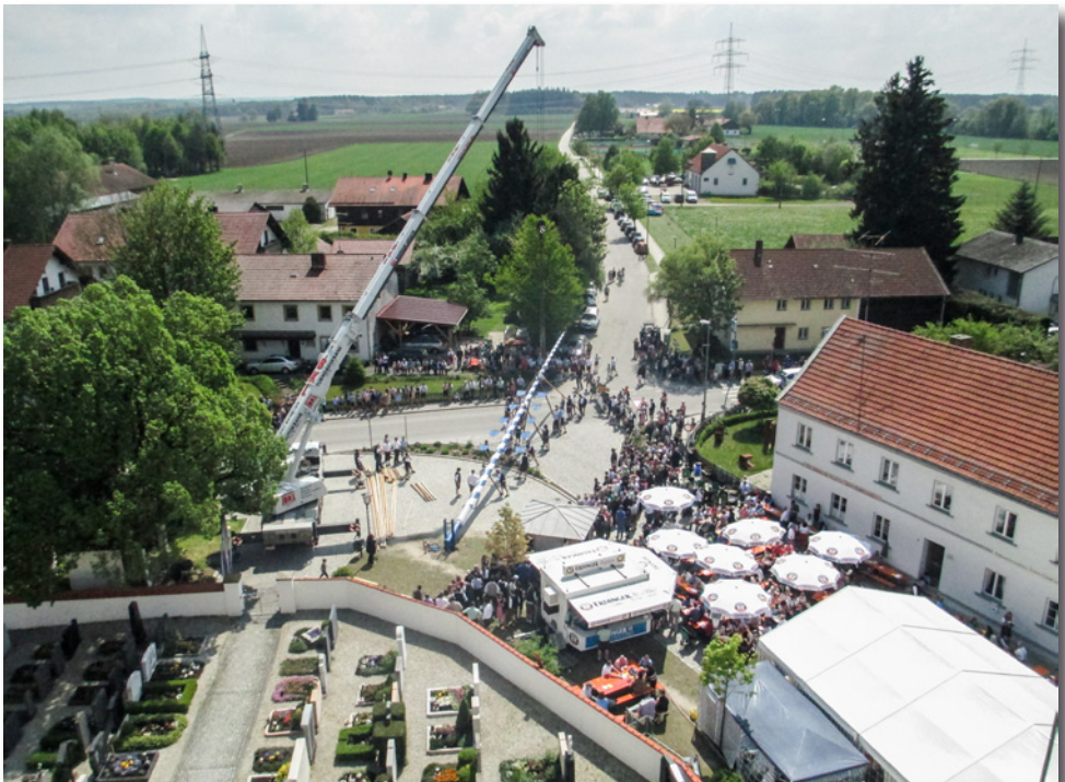
Den schönsten Blick auf das Maibaumfest hatte man sicherlich vom Kirchturm in Walpertskirchen

milie Zehetmair wurde am 5. April die Maibaumzeit eröffnet. Bei Kaffee und Kuchen und musikalischer Unterhaltung der Walpertskirchner Dorfkapelle konnte man es sich gut gehen lassen.