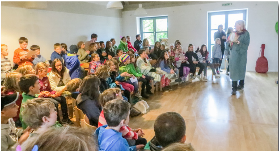
Die Kinder aus Wörth und Hörlkofen waren beim Bibeltag wieder voll dabei

Helfern wie Elisabeth Altmann die Kinderbibeltage aus der Taufe. Damals gingen diese noch über 3 Tage am Anfang der großen Ferien und verlangten dem Betreu-