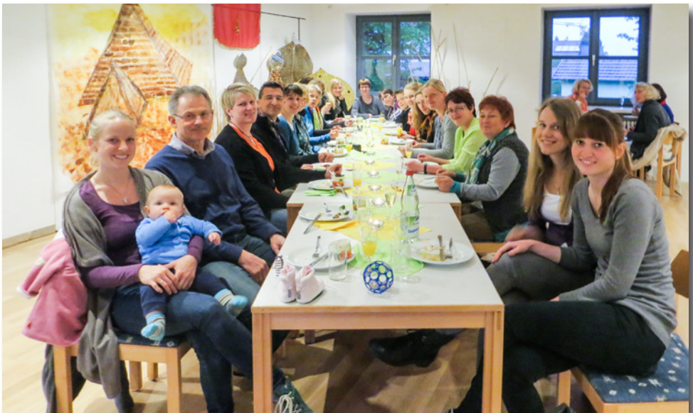
Beim abendlichen Jubiläumsfest

Beim abendlichen Jubiläumsfest waren u.a. auch alle ehemaligen GruppenleiterInnen zu einem ge-