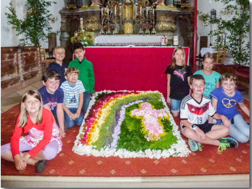
Der Blumenteppich für die Fronleichnamsprozession in Würth wurde von den diesjährigen Kommunionkindern gestaltet