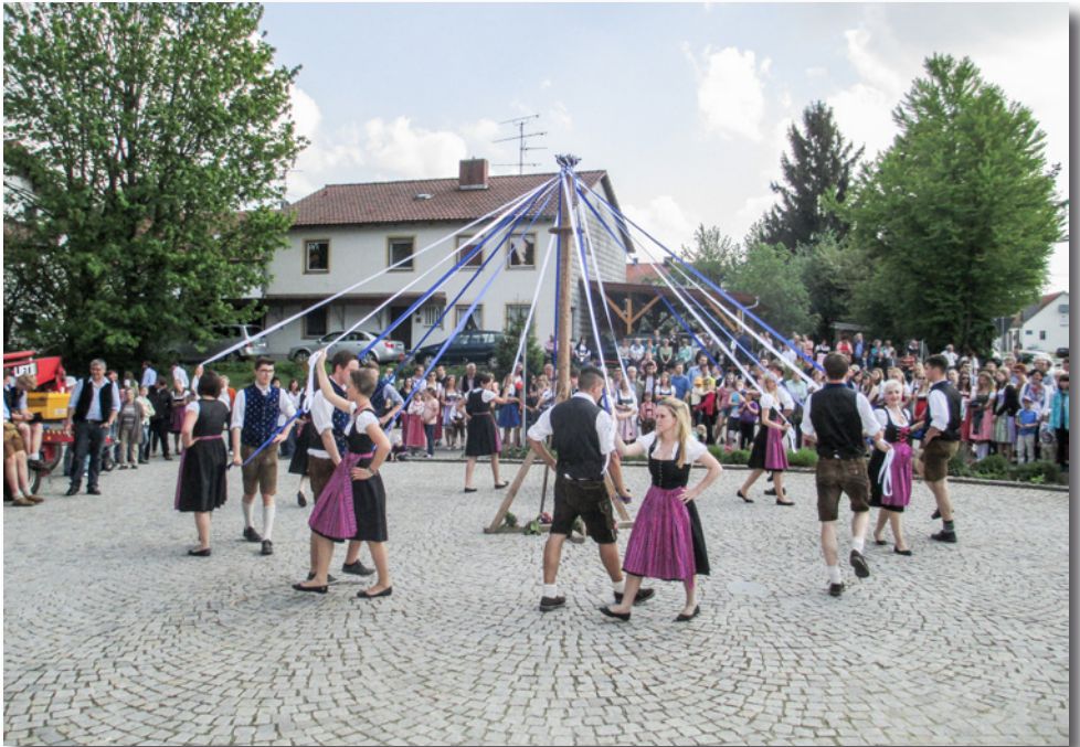
Nicht nur das Aufstellen des Maibaumes, auch der Bandltanz verlief ohne „Verwicklungen“