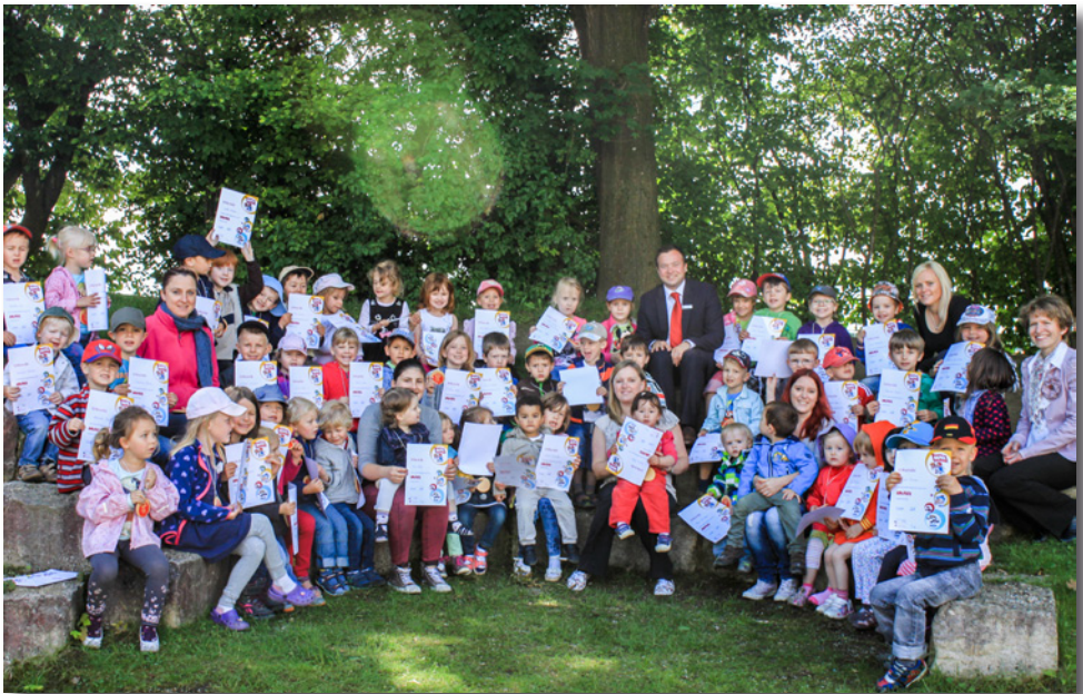
Das Mitmachen bei der „Knaxiade“ machte den Kindern des Wörther Kindergartens sichtbar Spaß (linkes Foto). Und am Ende gab es für Jede(n) eine Urkunde und eine Medaille

Die letzten Tage werden wir mit ein paar Ausflügen, einem Schulbus-training für die Schulanfänger und gaaaanz vielen schönen Stunden in unserem Garten vielleicht auch mit ein bisschen wasserpritscheln verbringen.