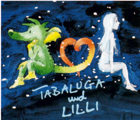
von Peter Maffay