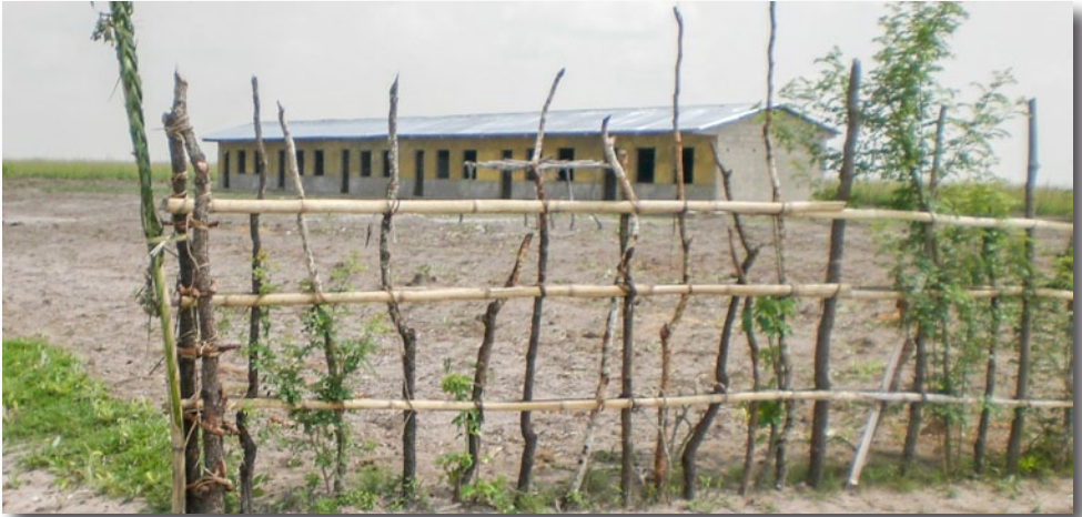
Angekommen in Luzolo! Eine schöne Schule auf weiter Flur!