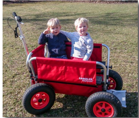
Ausfahrt im neuen Krippenwagen

Unser Jahresmotto lautet „Im Märchenwald“. Frau Holle, Sterntaler,