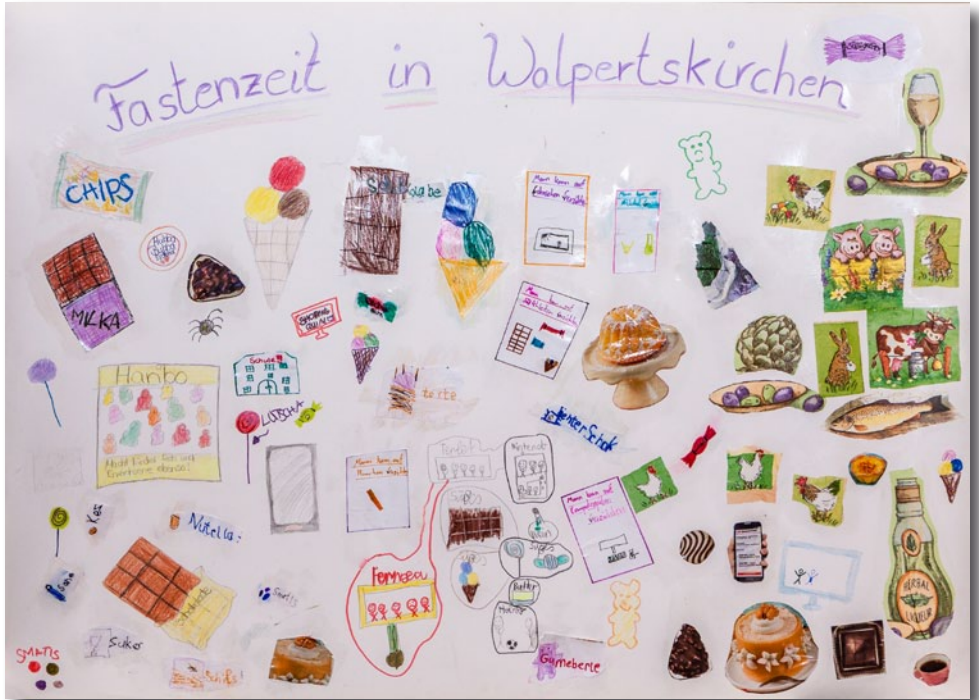
Auf was die Kinder aus Walpertskirchen in der Fastenzeit verzichten können, zeigt die von Ihnen angefertigte Collage