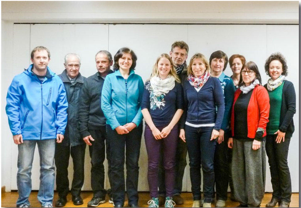
Die Mitglieder des Pfarrgemeinderates Wörth