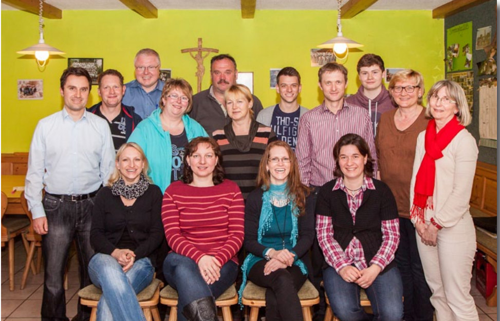
Die Mitglieder des Pfarrgemeinderates Walpertskirchen