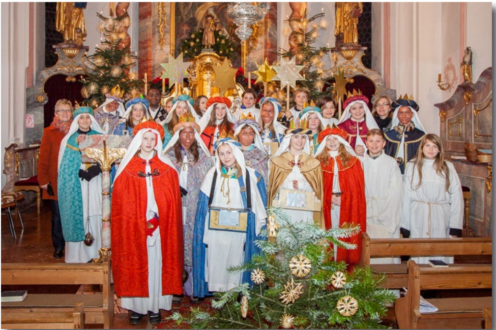
Die Sternsinger Walpertskirchen bei der Aussendung am Neujahrstag.