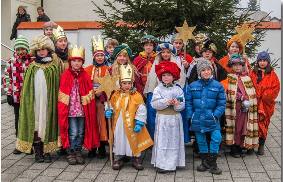
Die Sternsinger in Hörlkofen.