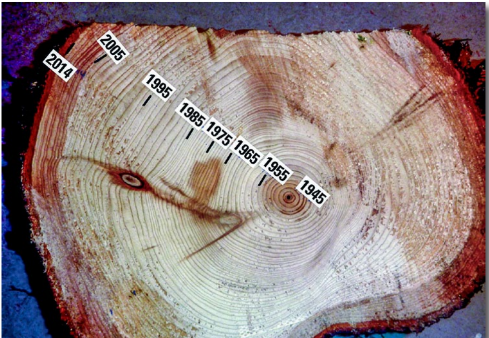
An der Baumscheibe vom Seitenarm der Thuye lassen sich schön die Jahresringe abzählen

Ein glatter Sägeschnitt am Fuße des dickeren Stammes hat mich dazu verleitet, die Jahresringe zu zählen. Ein überraschendes Ergebnis kam zutage! Die Thuyen rund um die Kirche wurden wahrscheinlich alle in der Zeit der Fertigstellung bzw. Einweihung unserer Kirche gepflanzt, sind also knapp 90 Jahre alt. Der Seitenarm selbst kam auf 68 Jahresringe.