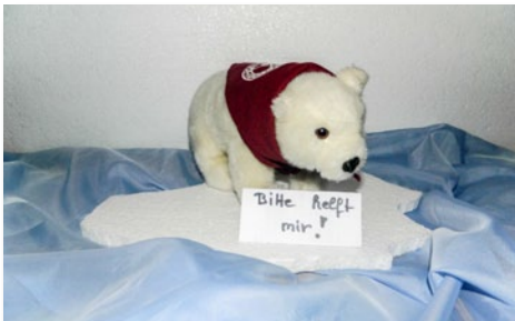
Durch die Klimaerwärmung „schmilzt“ der Lebensraum der Eisbären

Dieses Projekt wurde von der Pfadfinderinnenschaft St. Georg Landesstelle Bayern e. V. ins Leben gerufen. Hierbei soll versucht werden, durch klimafreundliches Verhalten die Welt eines kleinen Eisbären Namens Anouk abzukühlen.