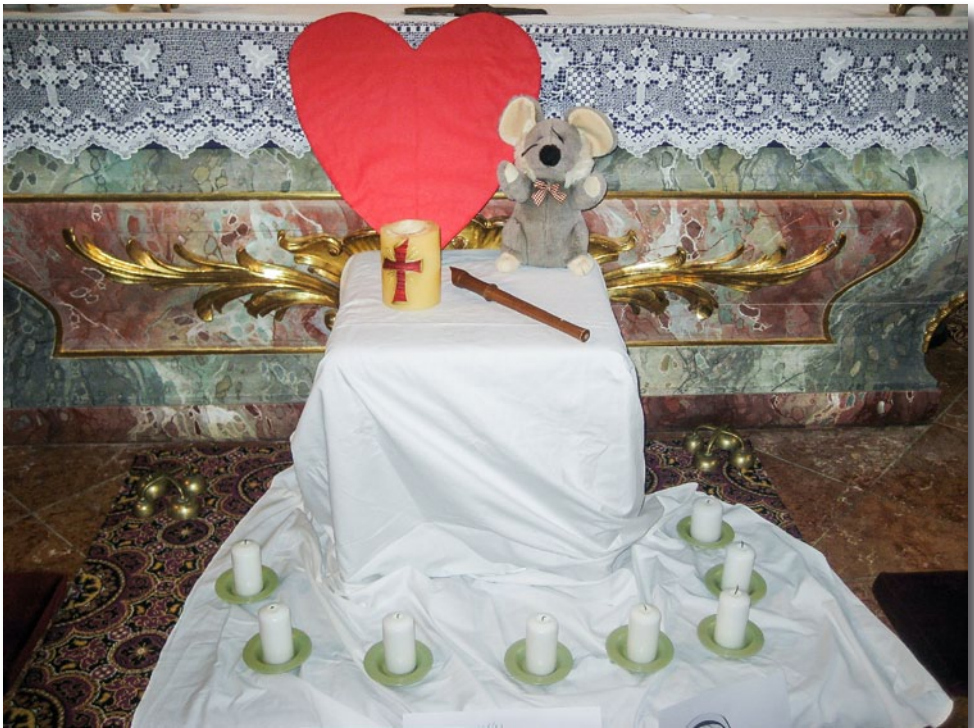
Die kleine Maus mit dem grossen Herzen war das Thema des Kinderwortgottesdienstes im Dezember 2013