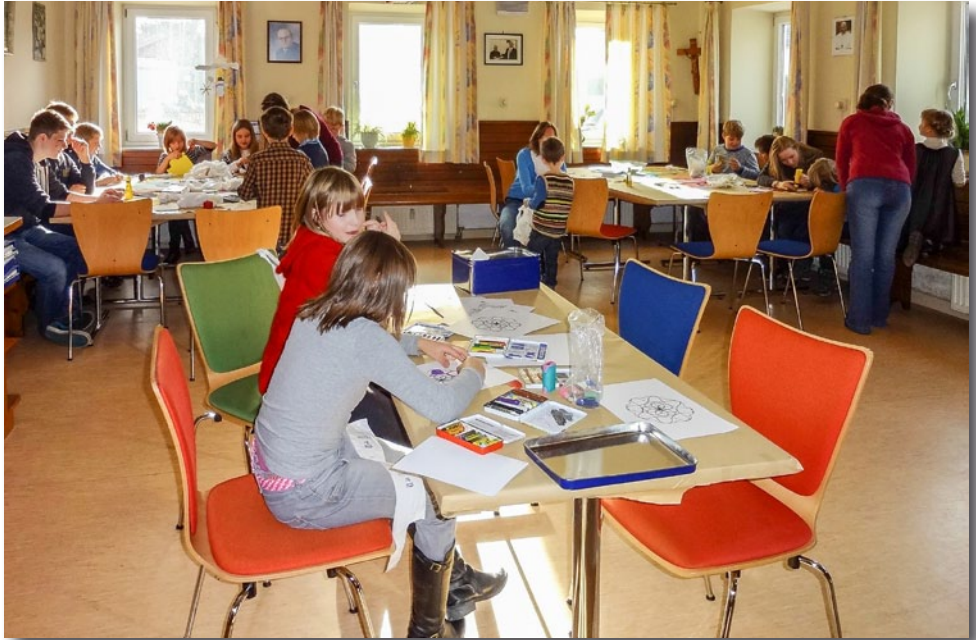
Im Pfarrheim Hörlkofen verging die Wartezeit bis zur Bescherung wie im Flug