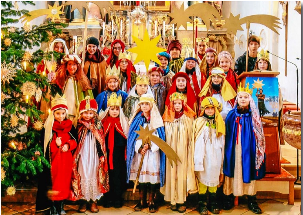
Die Sternsinger aus Wörth